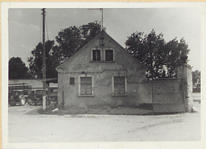
1. Elewacja pn.-wsch.