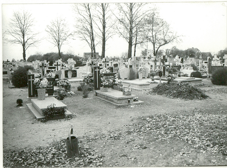
3. Fragment cmentarza z nagrobkami