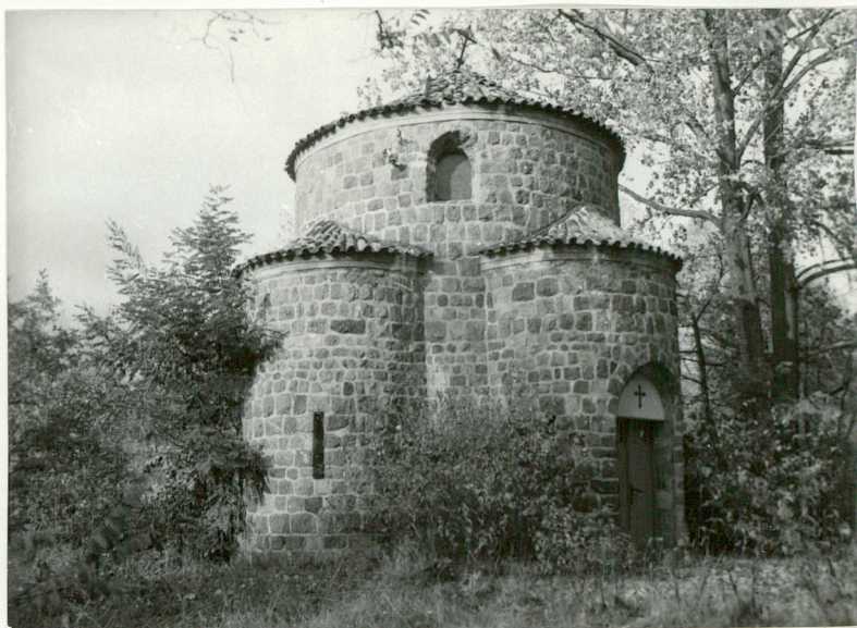
2. Kaplica cmentarna