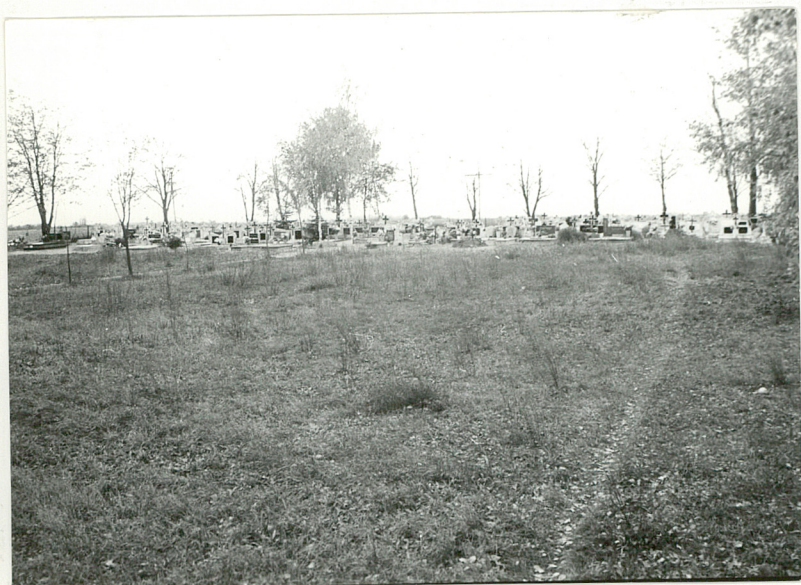
1. Widok ogólny cmentarza