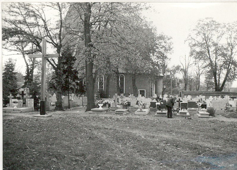
1. Widok ogólny na cmentarz