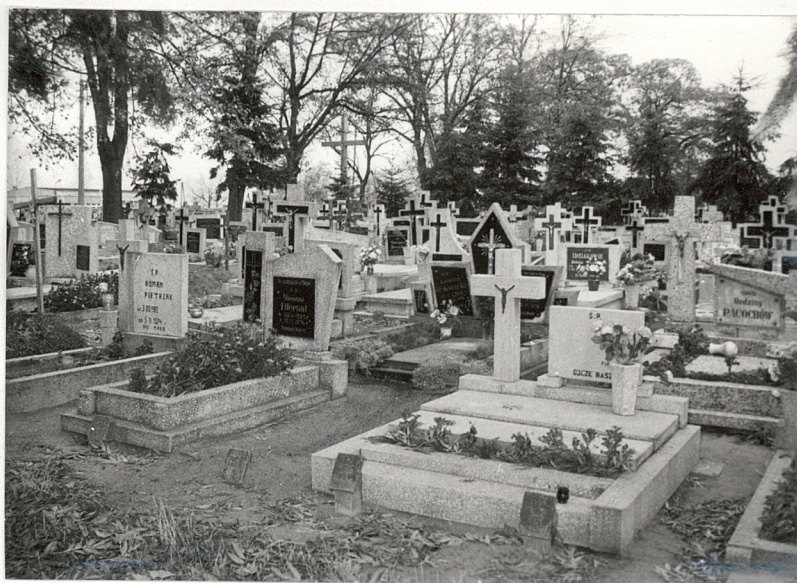
3. Fragment cmentarza z nagrobkami