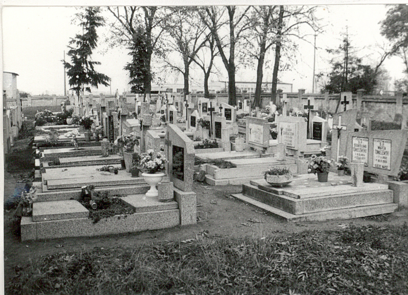
2. Fragment cmentarza z nagrobkami