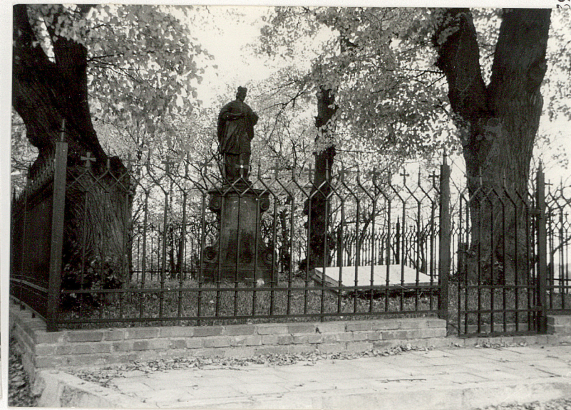
3. Fragment ogrodzenia