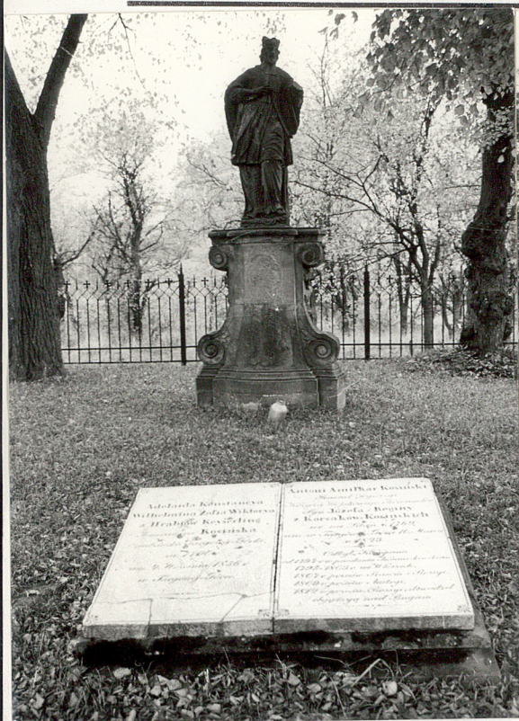
1. Tablica nagrobna z rzeźbą w tle