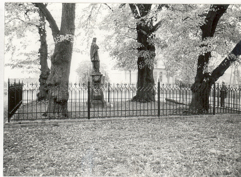
4. Widok ogólny z boku