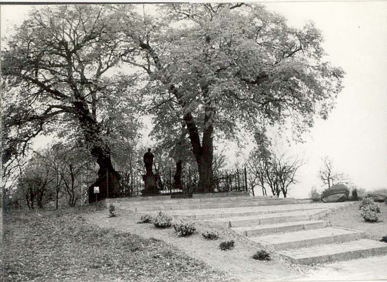
2. Widok ogólny od strony ulicy