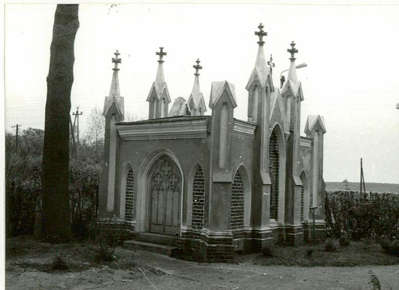
2. Grobowiec rodziny KARŚNICKICH