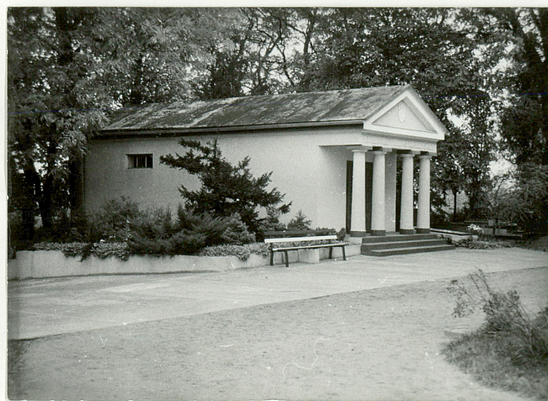
4. Grobowiec rodziny KARŁOWSKICH