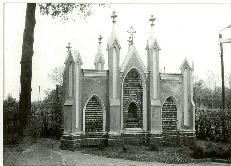
3. Grobowiec rodziny KARŚNICKICH