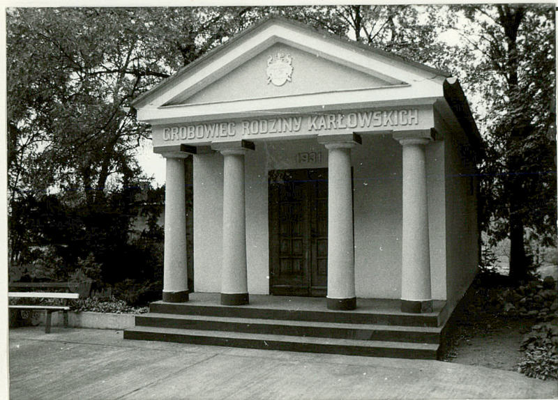
1. Grobowiec rodziny KARŁOWSKICH