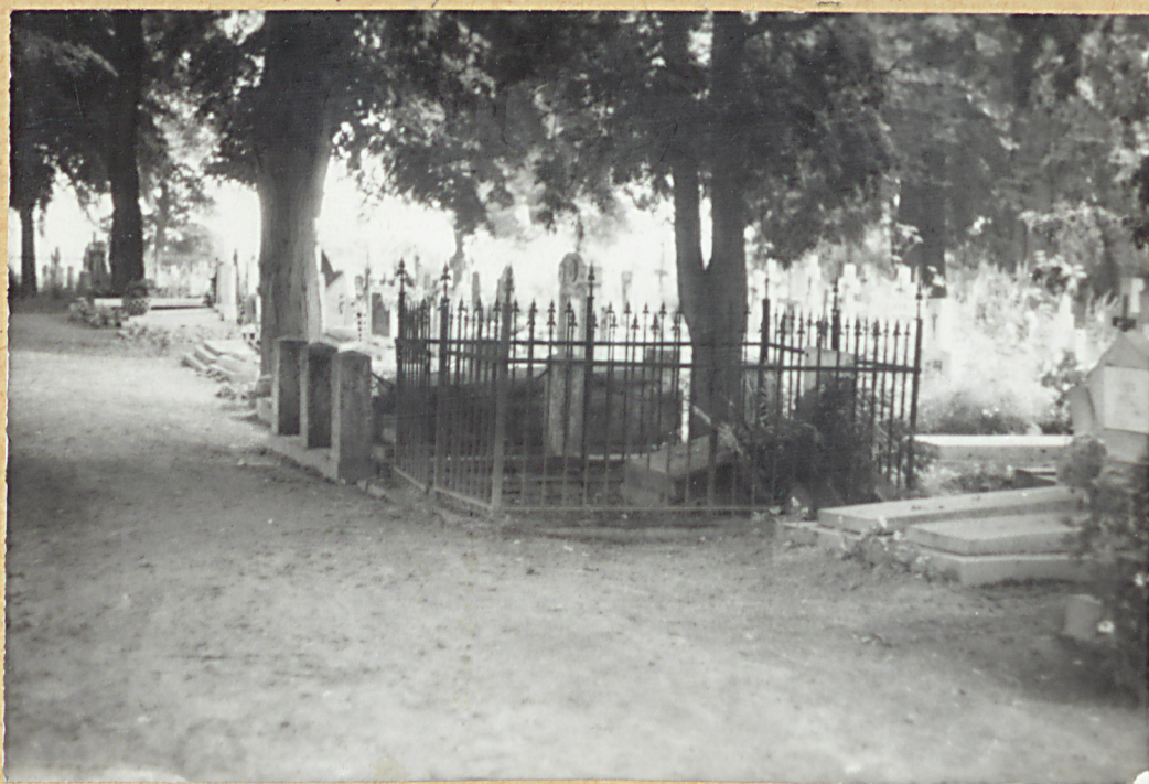
1. Pomnik Powstańców Wielkopolskich. 2. Na jstarszy grób.