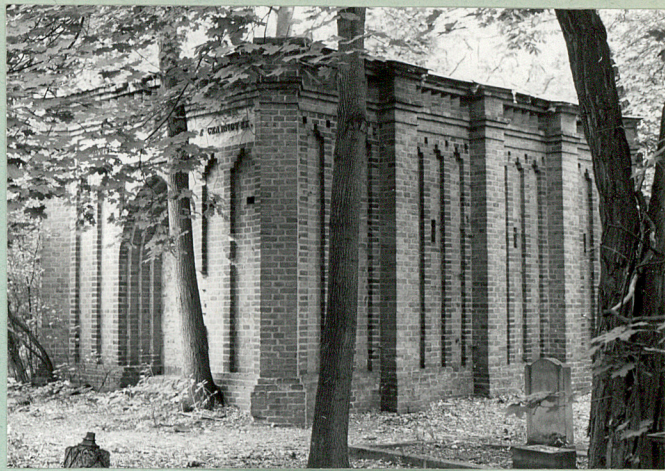
Grobowiec Karczewskich XIX w.