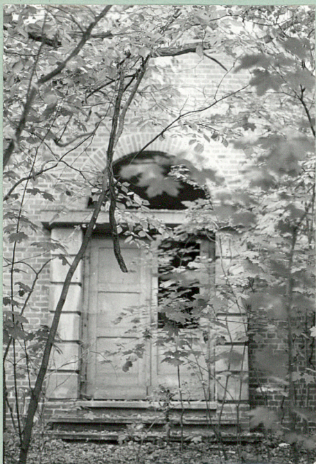
Wejście do kaplicy