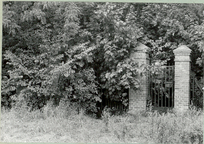
Brama i furta.