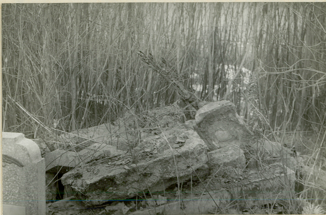
5 . Zniszczone stare nagrobki