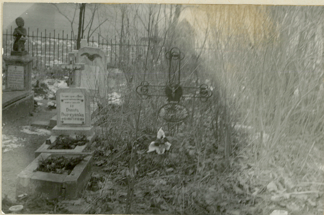
3. Niszczące stare groby