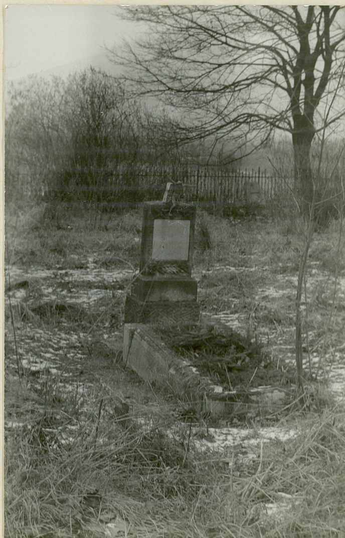
4. Najstarszy nagrobek