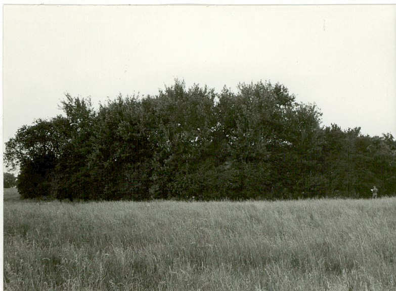
Fot. 1. Widok ogólny cmentarza.