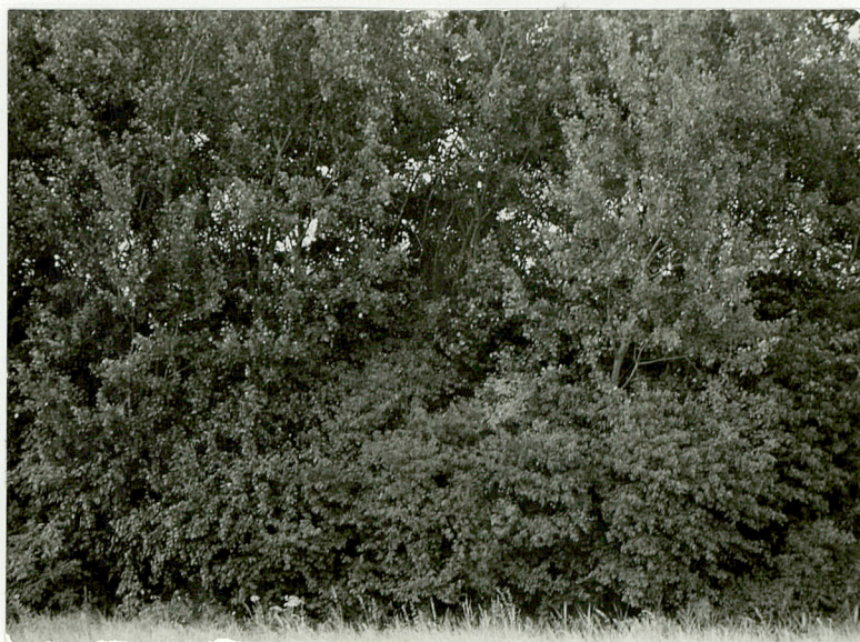
Fot. 2. Widok wnętrza cmentarza.