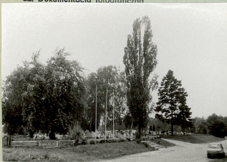
1/ Widok ogólny cmentarza