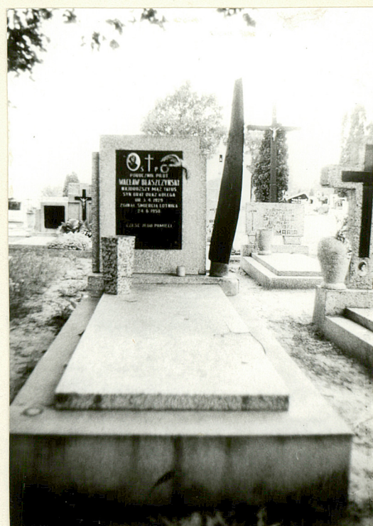
8/Nagrobek Wacława Błaszczyńskiego