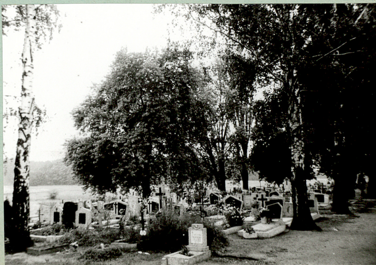
4/ Widok na środkową kwaterę pd.