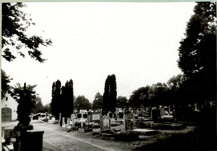
3/ Widok na pn-zach kwaterę