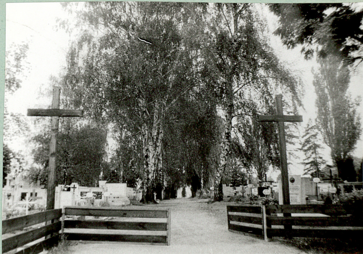
2/ Widok bramy i gł. alei