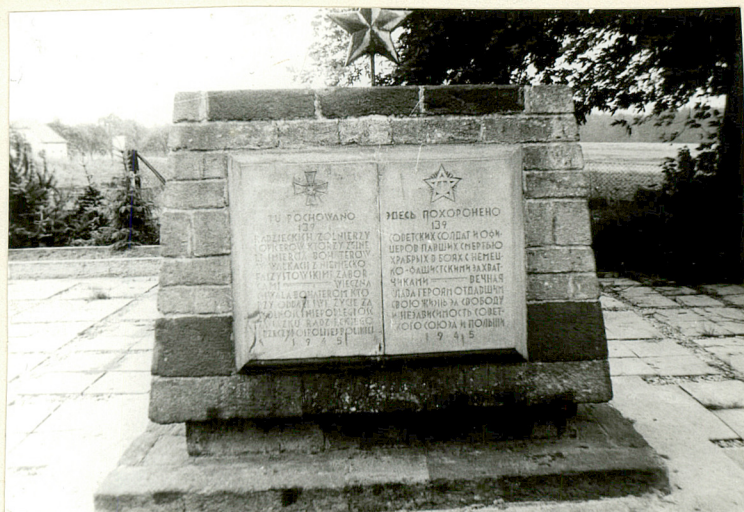
6/Pomnik ku czci żołnierzy radzieckich