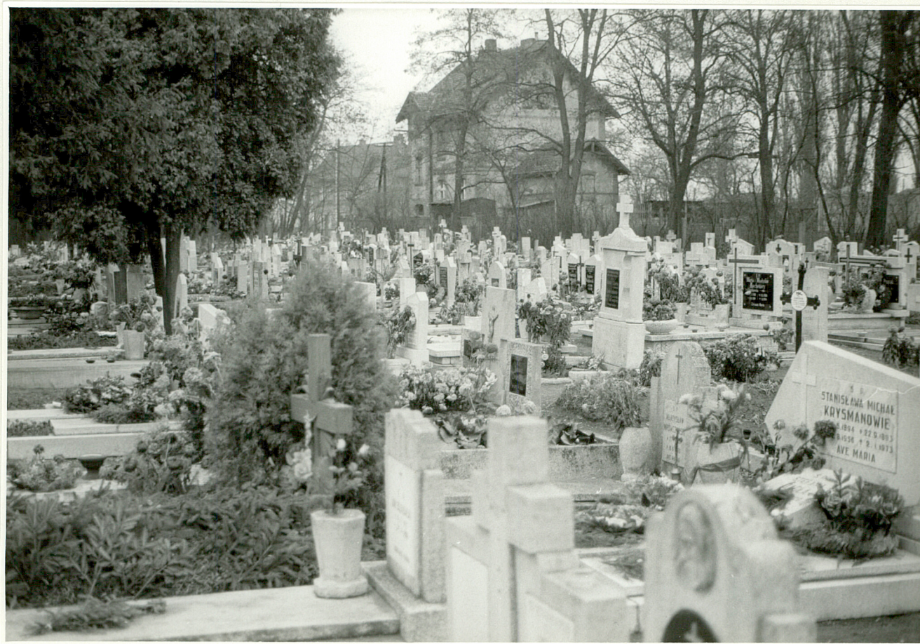
3. Kwatery w Pn-wsch.części cment.z dworcem PKP w tła.