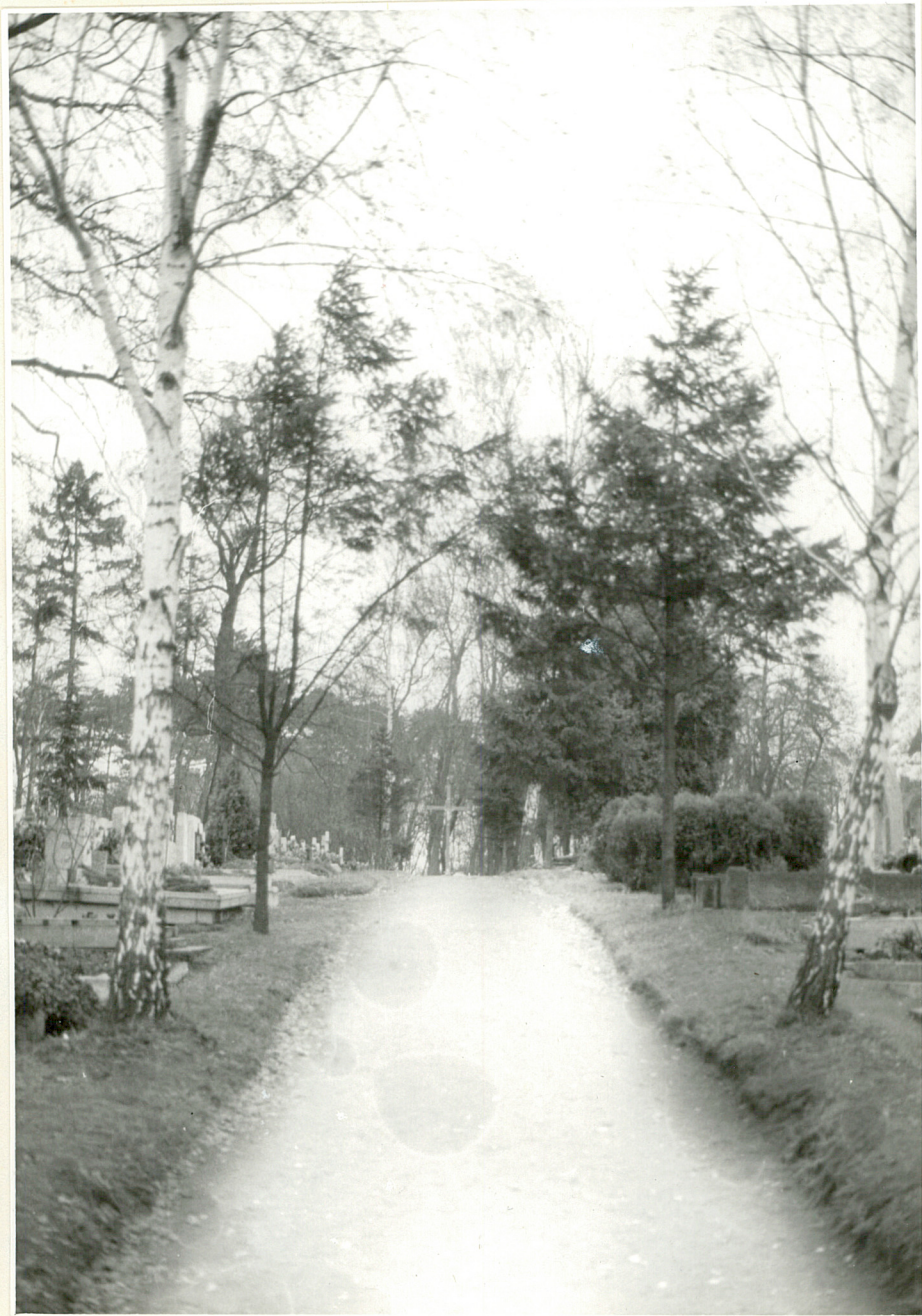
1. Główna aleja cmentarza biegnąca w kierunku krzyża cment.