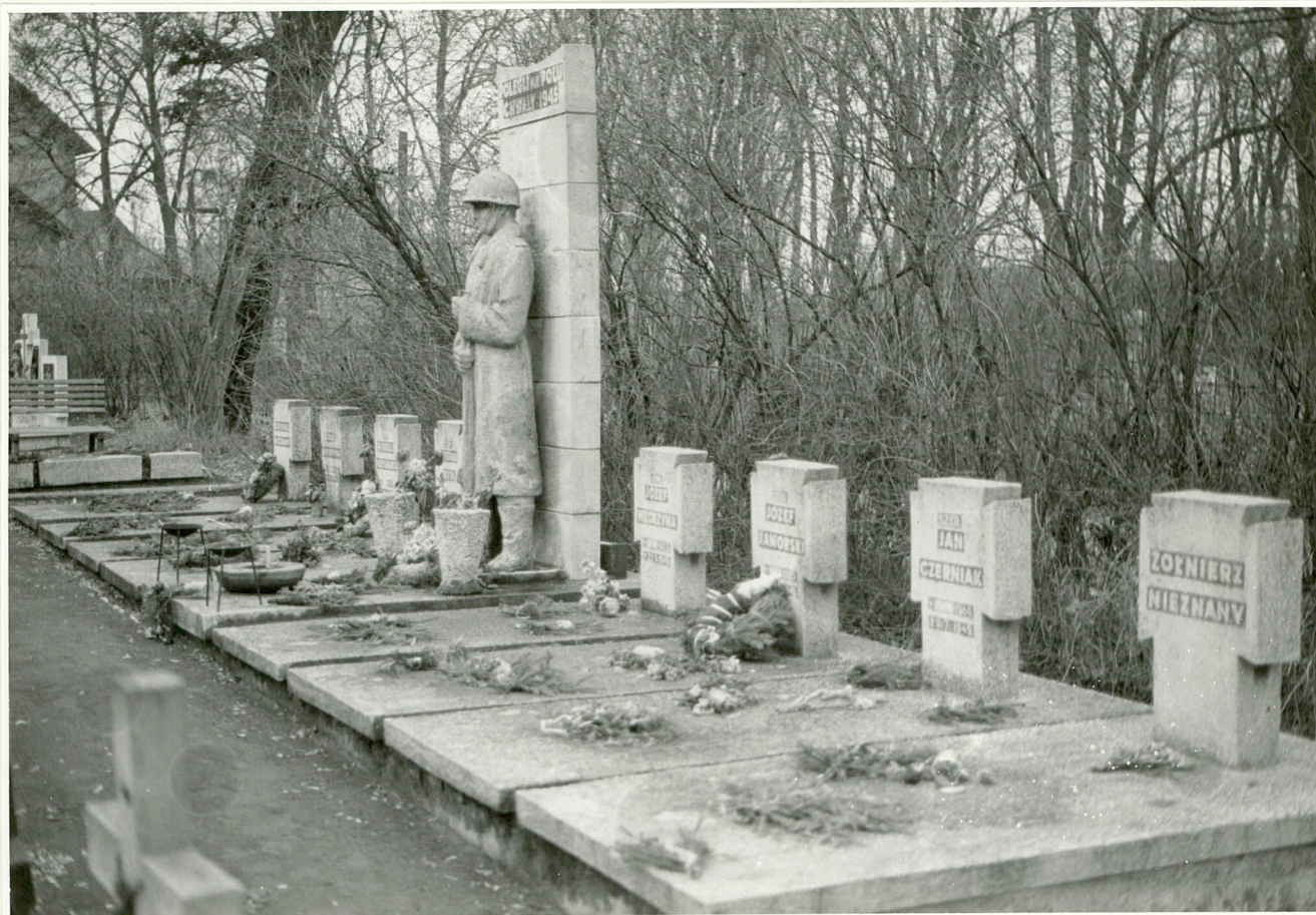
4 Groby żołnierzy poległych w 1945 roku.