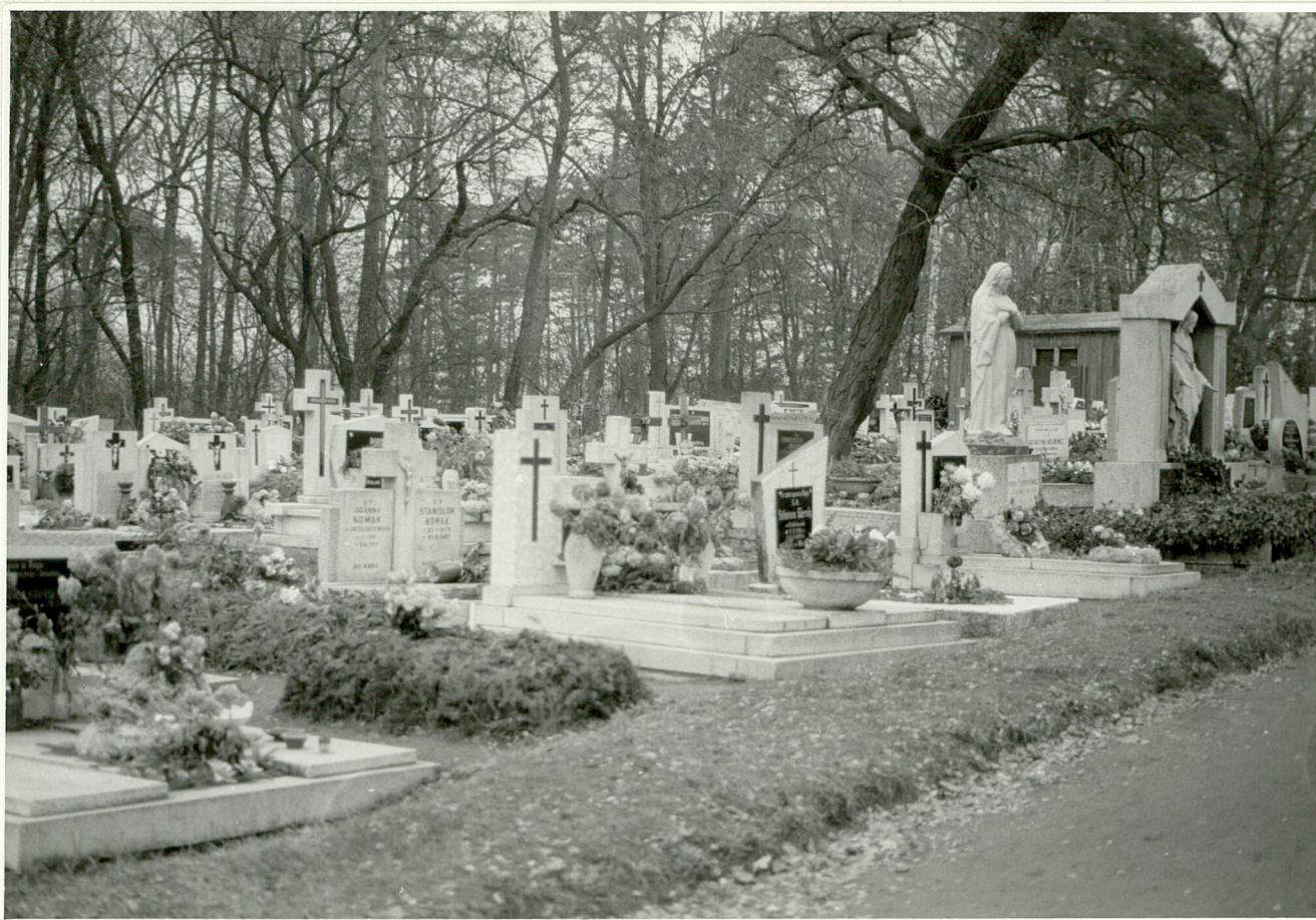
2. Fragment Pn-zach. cmentarza z widocznymi nagr.przy gł.alei.