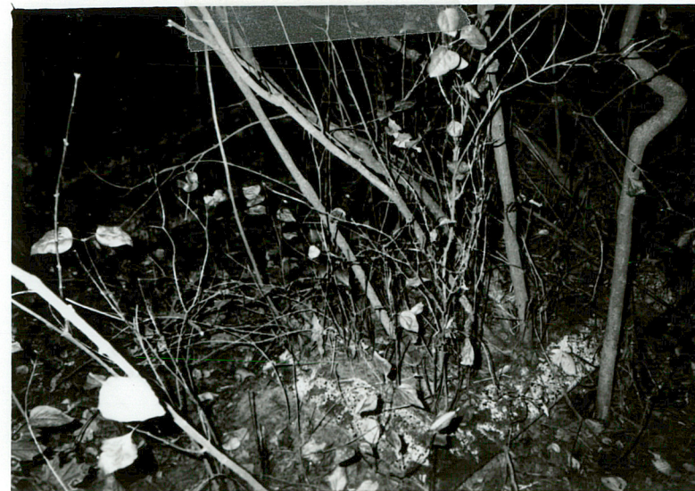
PARA OBMUROWANYCH MOGIŁ NN