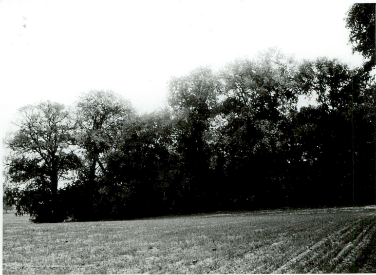
WIDOK OGOLNY od strony Orchowa