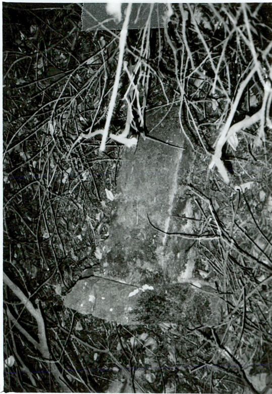
PRZEWROCONY FRAGMENT NAGROBKA NN piaskowiec / 6 /