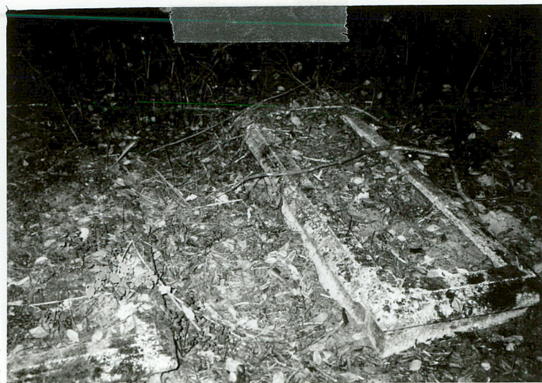
PARA OBMUROWANYCH MOGIŁ NN

3. Zawartość wkładki (nazwa obiektu lub materiału uzupełniającego) FOTOGRAFIE