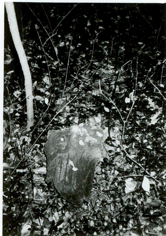
PODSTAWA KRZYŻA NAGROBNEGO NN piaskowiec, żeliwo / 9 / żeliwny krzyż odłamany