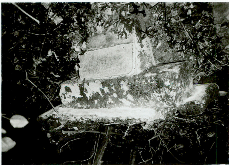
FRAGMENT NAGROBKIA NN sztuczny kamień, blacha widoczna data 1913 / 8 /