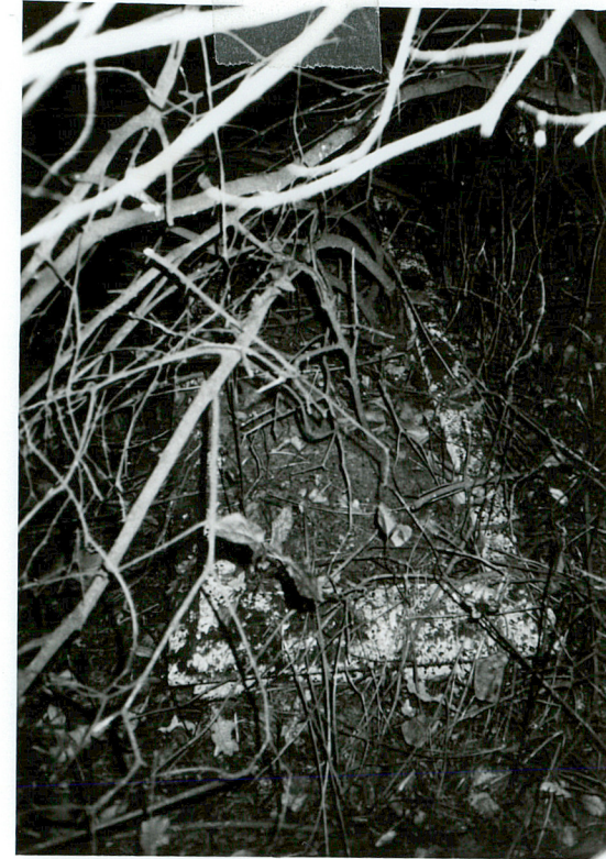
OBMUROWANA MOGIŁA NN sztuczny kamień / 5 /

Wkładkę założył: J.Żera-Janiszewska ..... (imię, nazwisko, data)