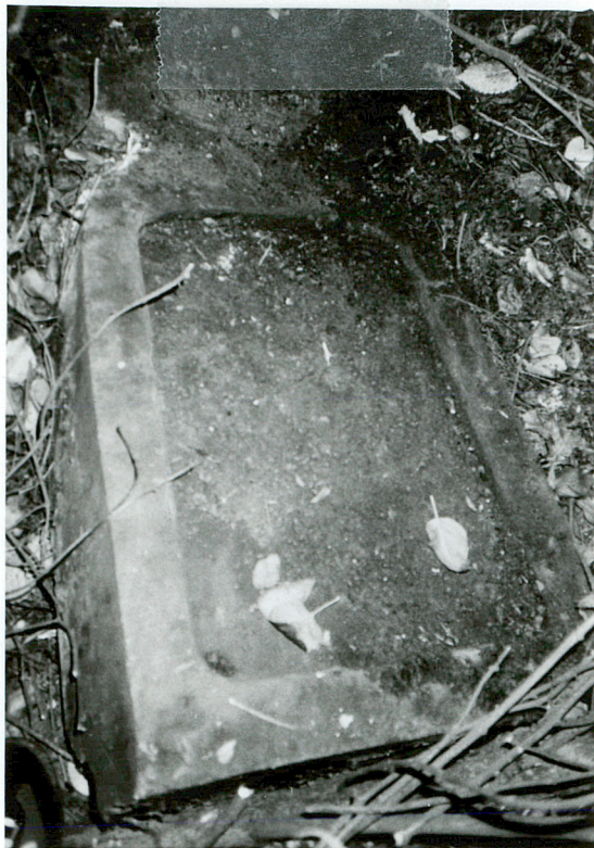
NAGROBEK NN przewrócony, zniszczony piaskowiec / 2 /