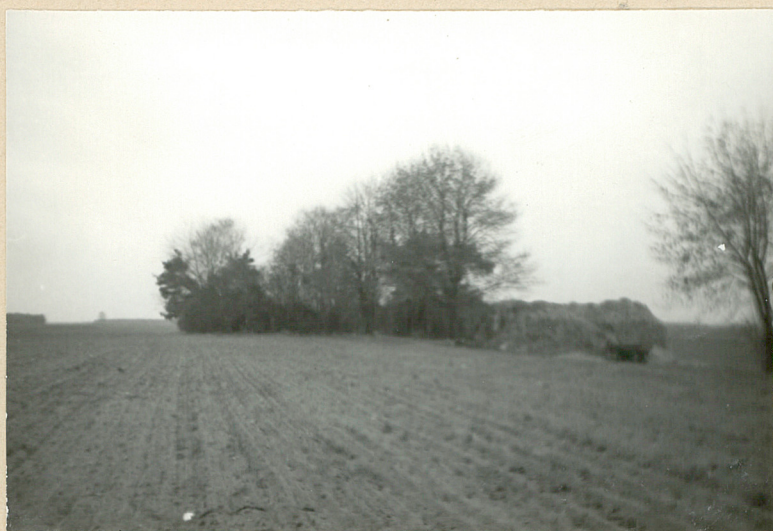
Widok ogólny cmentarza