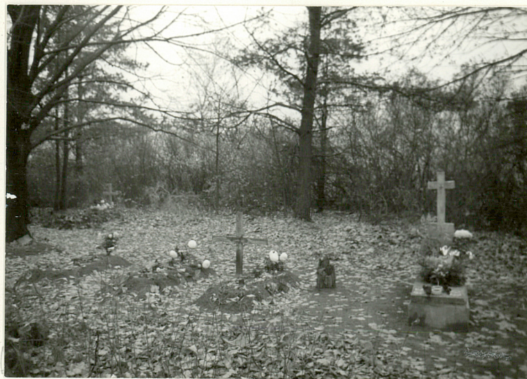
bezimienne mogiły 1 poł.XXw. /4/