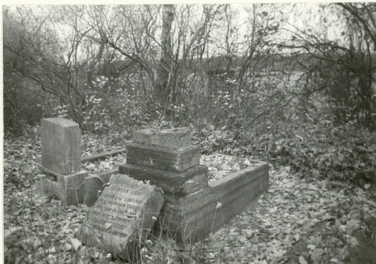
nagrobek z 1 poł. XXw. August Matys zm. 1926 /3/