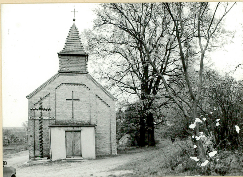
Fot. 1. Kościół filialny.