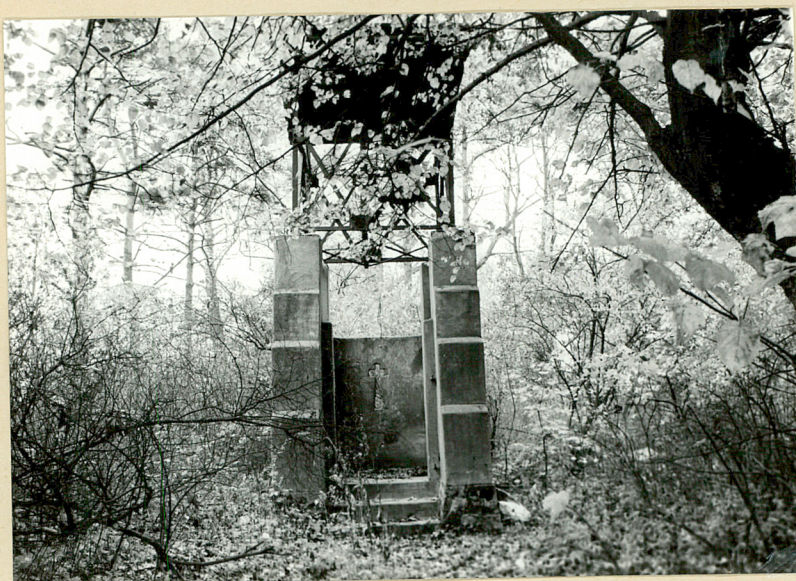
Fot. 2. Słonnica.