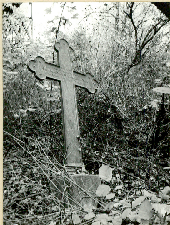
Fot. 4. Krzyż mogiły z 1859 roku.