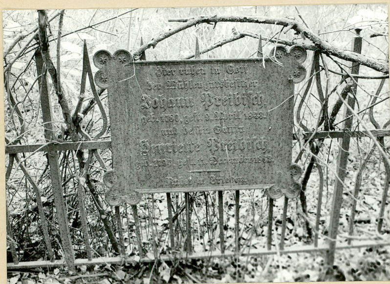
Fot. 3. Kwatera rodzinna - tablica z 1862 roku.