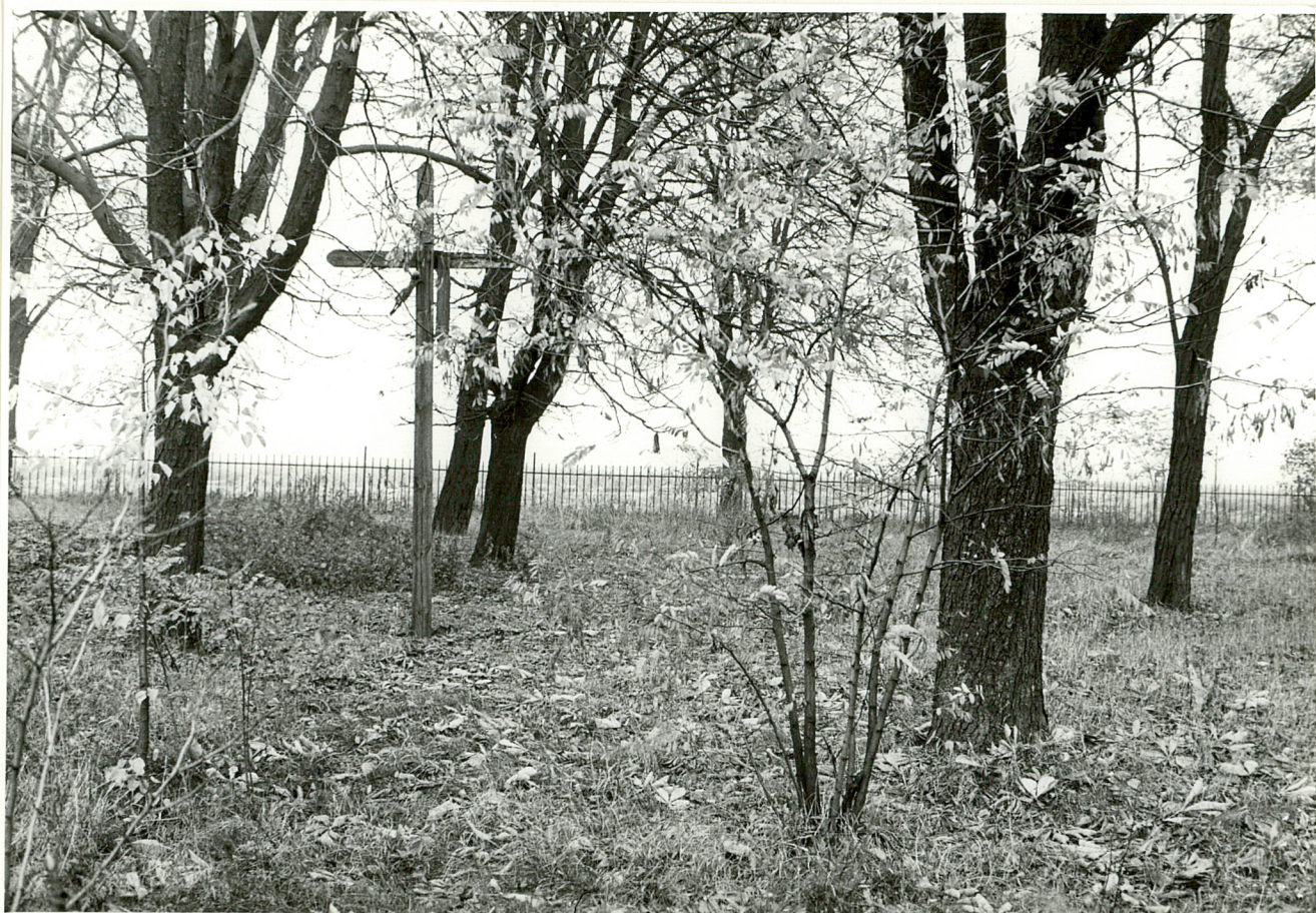
1. Widok na krzyż drewniany od strony bramy cmentarza.