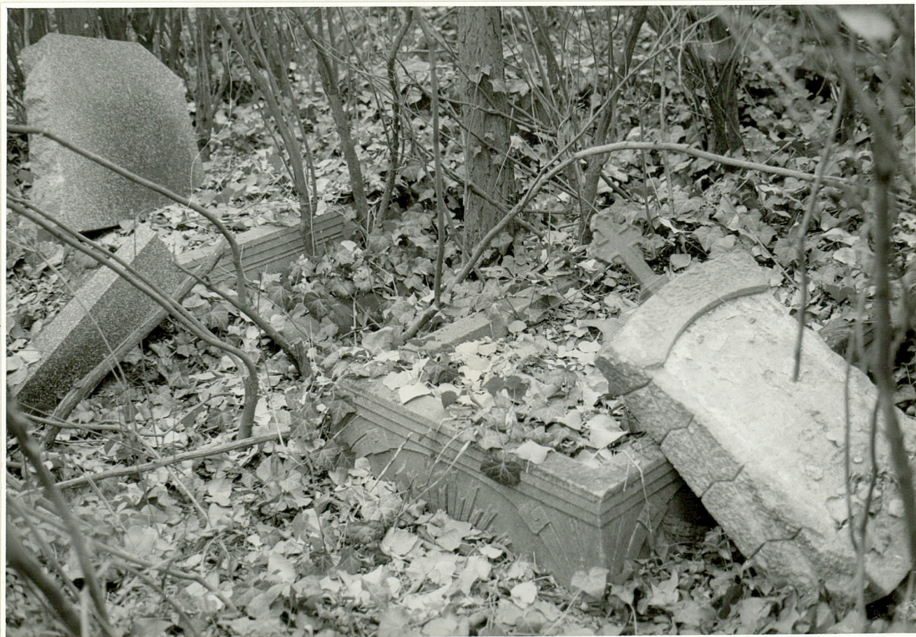
4. Fragmenty nagrobków zachowane w części Pn-zach.