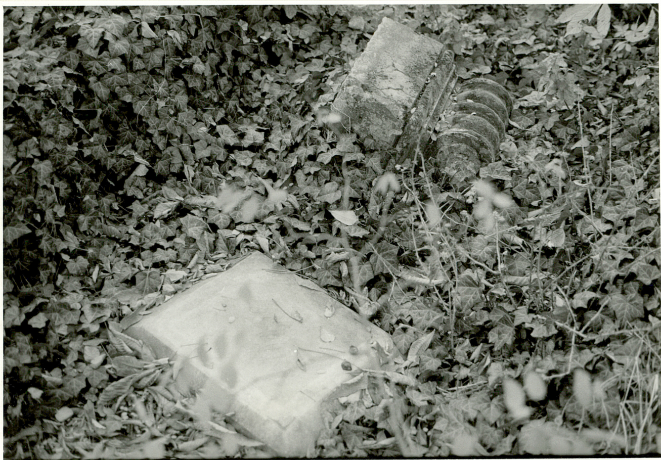
3. Fragment zachowanego nagrobka z pocz.XX wieku.