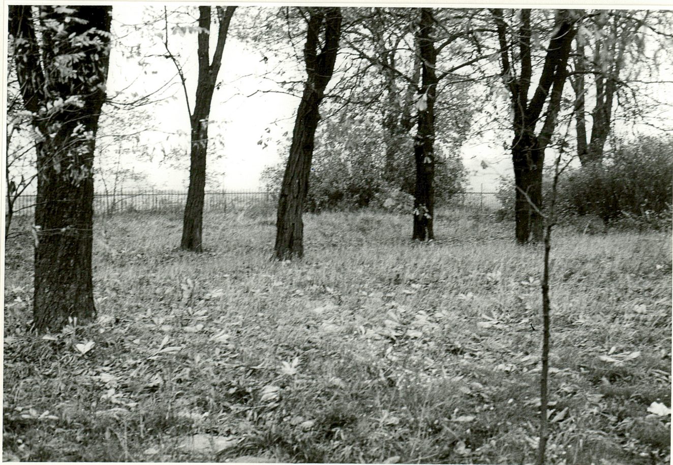
2. Fragment Pd.-zach. cmentarza.