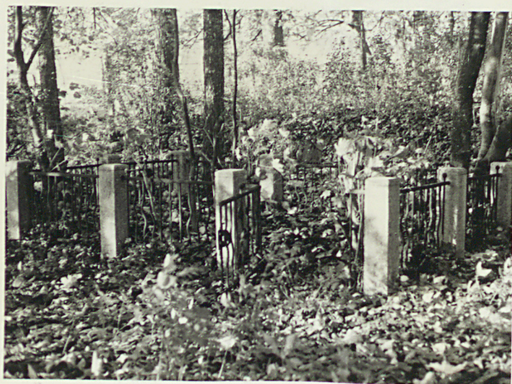
Dolaszewo; cmentarz komunalny 1. Ogólny widok kwatery czynnej 2. Krzyże nagrobne na kwaterze dawnej 3. Ogrodzenie kwater rodzinnych