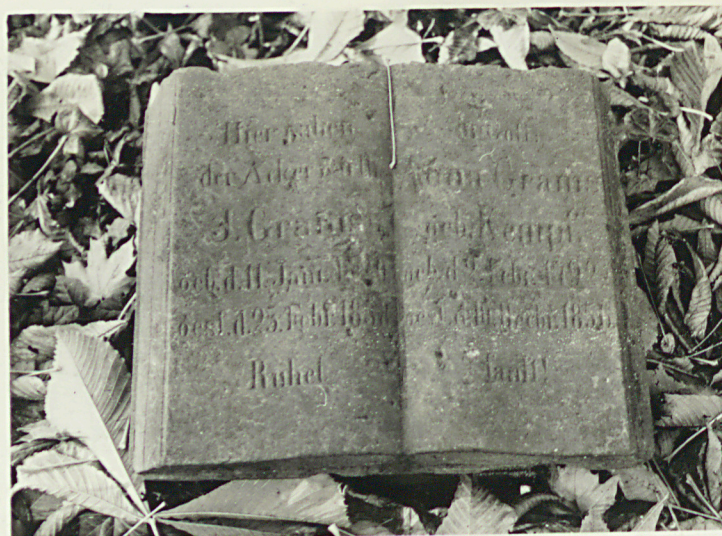
4. Głaz nagrobkowy 5 i 6. Płyta nagrobkowa w kształcie otwartej książki z 1856 roku