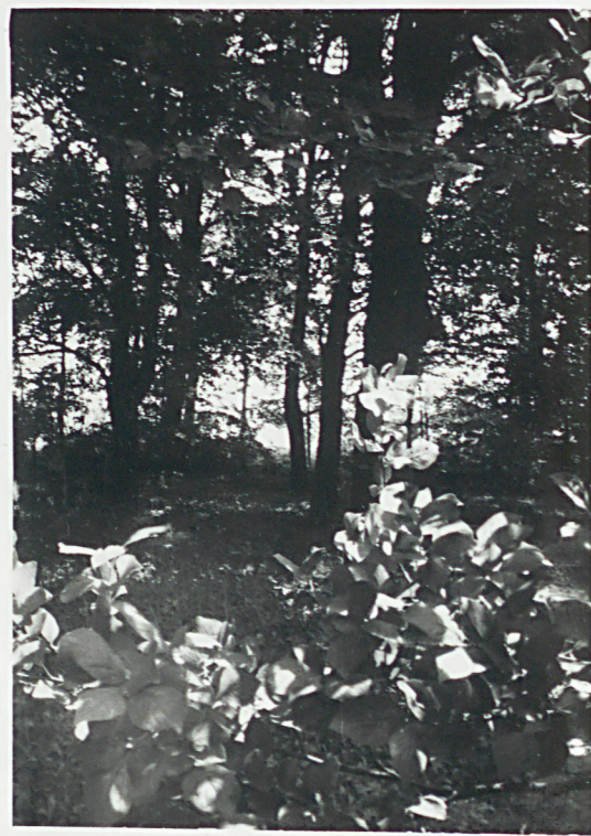
5. ALEJA W CZĘŚCI PD.