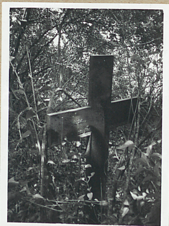
12- PD. CZĘŚĆ CMENTARZA