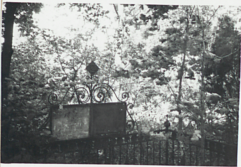
8-11. ŻELIWNE OGRODZENIA MOSIK 9