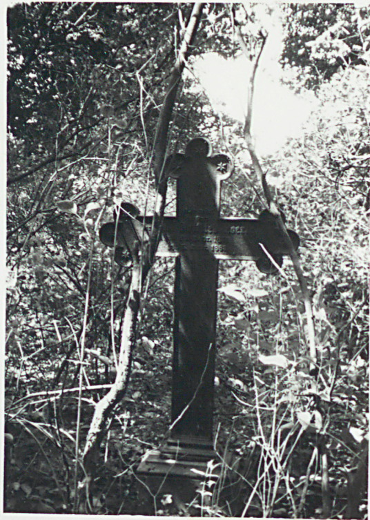
4. KRZYŻ G. SOERTE +1892.