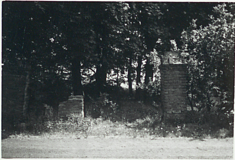
1. WEJŚCIE GL.