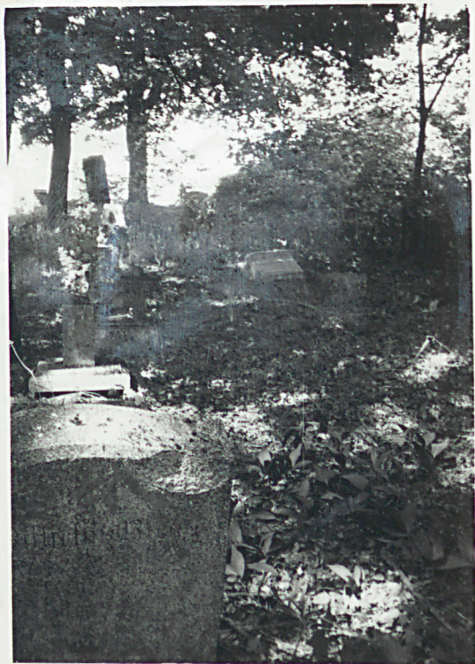
3. KWATERA PD.