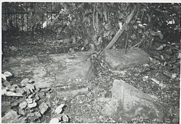
2. ROZBITA PIASKOWCOWA PŁYTA