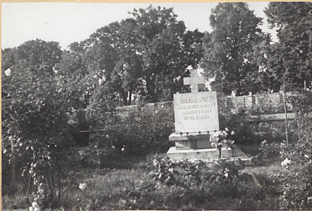
1. kaplica omentarna, 2. wnetrze kaplicy - tablica z nazwiskami pomordowanych duchownych w okresie II wojny 3. oparkanione nagrobki wzduż muru, 4. południowa ściana kościoła z tablicami epitafijnymi, 5. symbol. nagrobek, upamiętniający rozstrzelanie 22-23.11.1939 r.