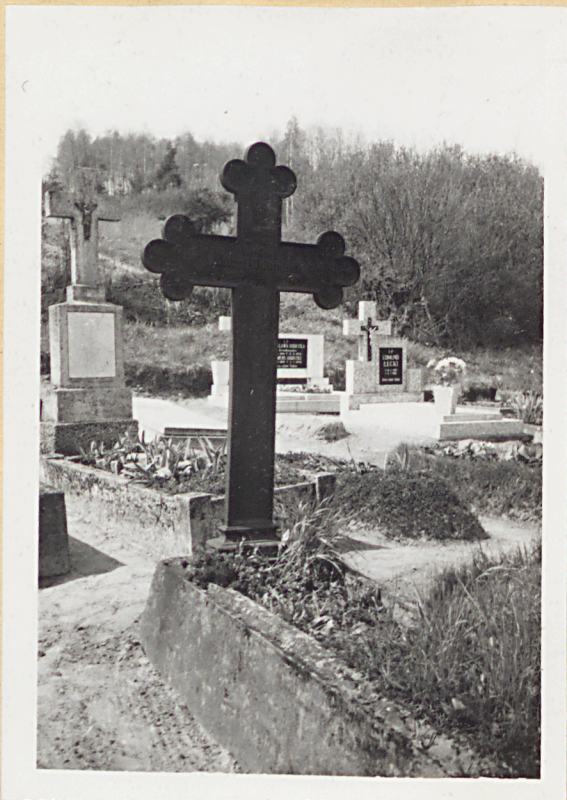
12-14. KRZYŻE ŻELIWE