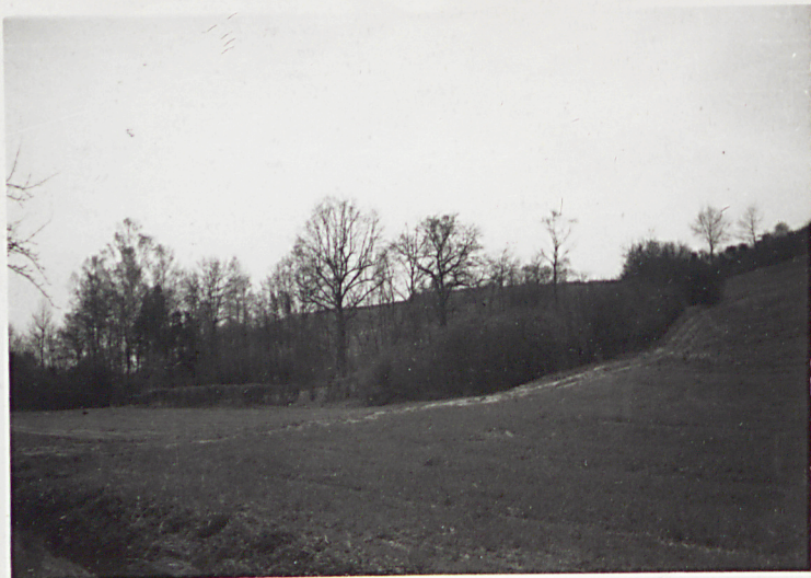
7. WIDOK OGÓLNY