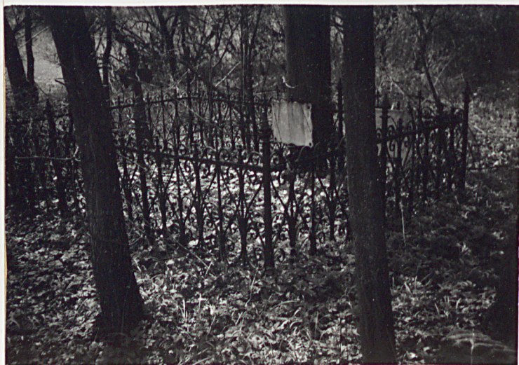
6. ODKODZENIE MŁDEK