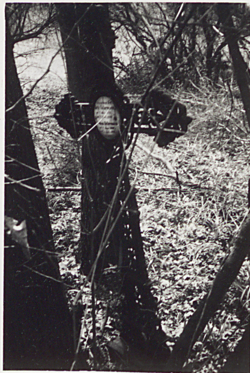
4. KRZYŻ ŻELIŃNY