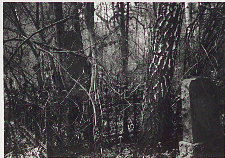
8. ŻELIWNIE OGRODZENIE MOGIL