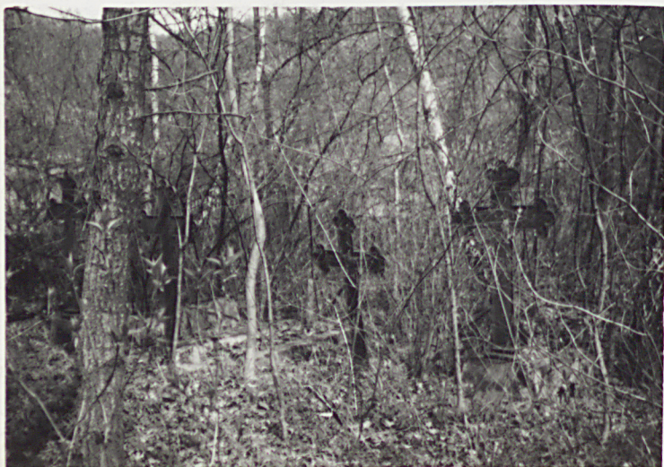
5. ZESPÓŁ KRZYŻY ŻELIŃNYCH