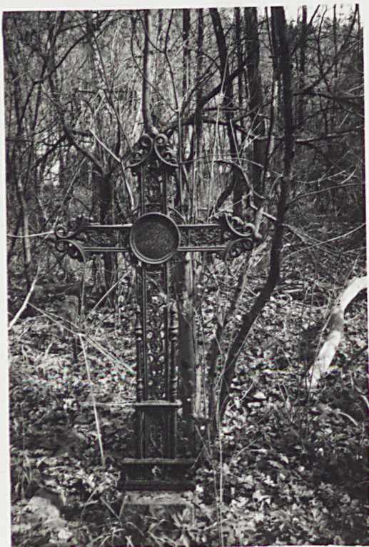
9-M KRZYŻE ŻELIWNIE