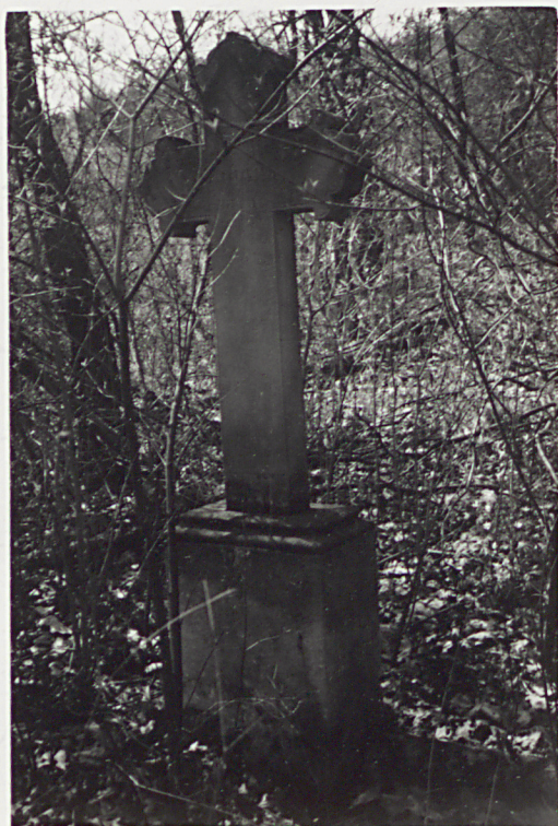
3. KRZYŻ ANTON RODZIŃSKI 1853 + 1882