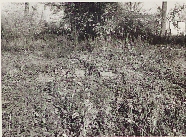
Pokrzywnica; cmentarz przykościelny 1. Widok ogólny - fasada kościoła i mur ogrodzeniowy 2. Ślady mogił Negatywy: WKZ Piła XI 1987 r.