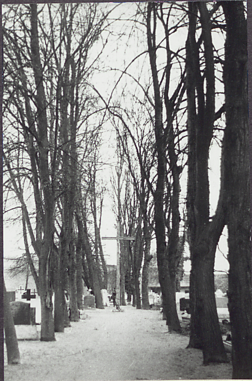
1. Główna aleja cmentarza