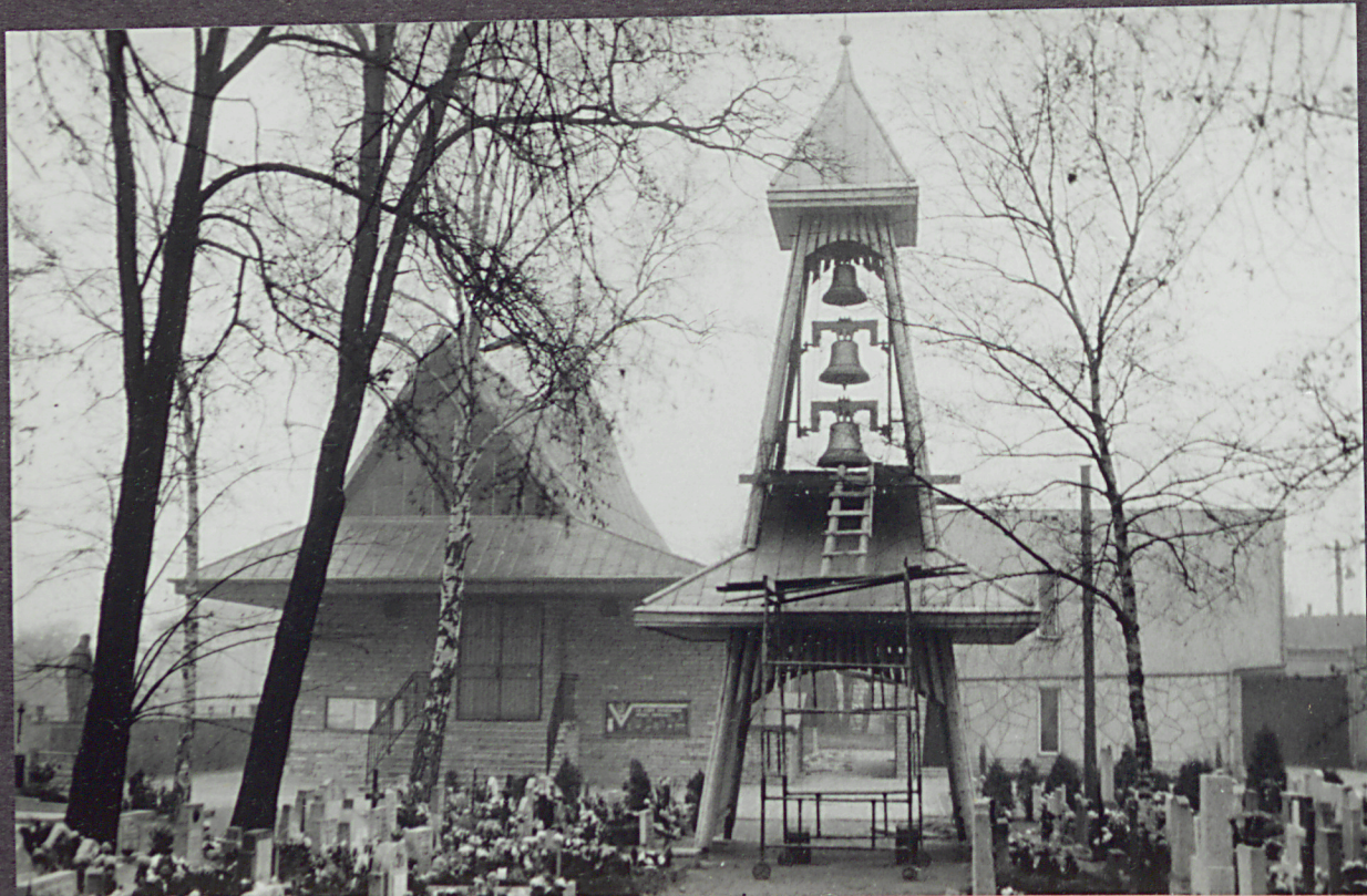
2. Widok na kościół i budowaną dzwonniceę od strony cmentarza