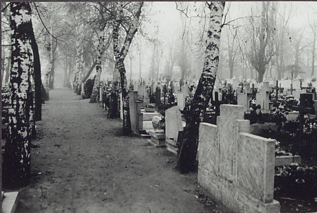
3. Widok cmentarza od strony zachodniej