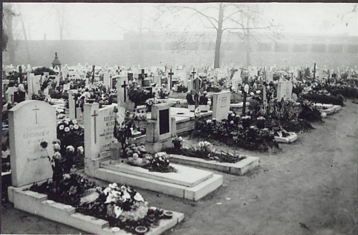
4. Widok na pd-zach. kwaterę