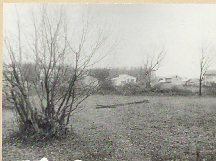
Widok ogólny cmentarza