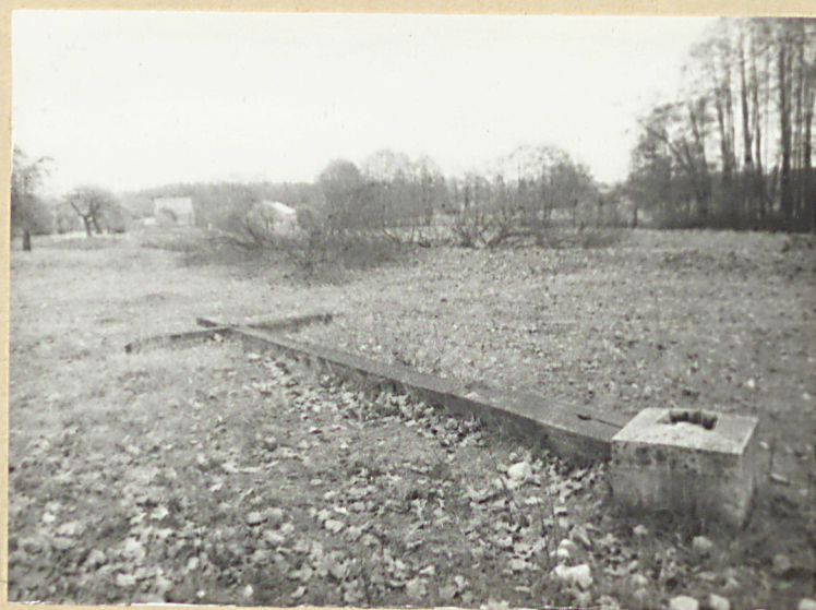
Krzyż cmentarny /przewrócony/