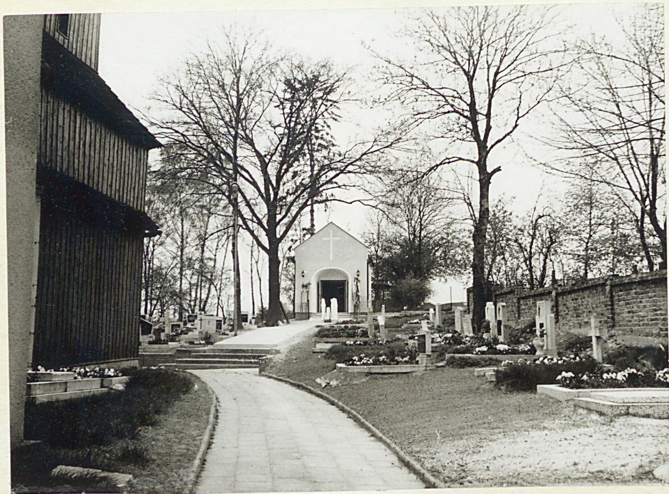
3. Widok na kaplicę cment. od strony elewacji Pn k.