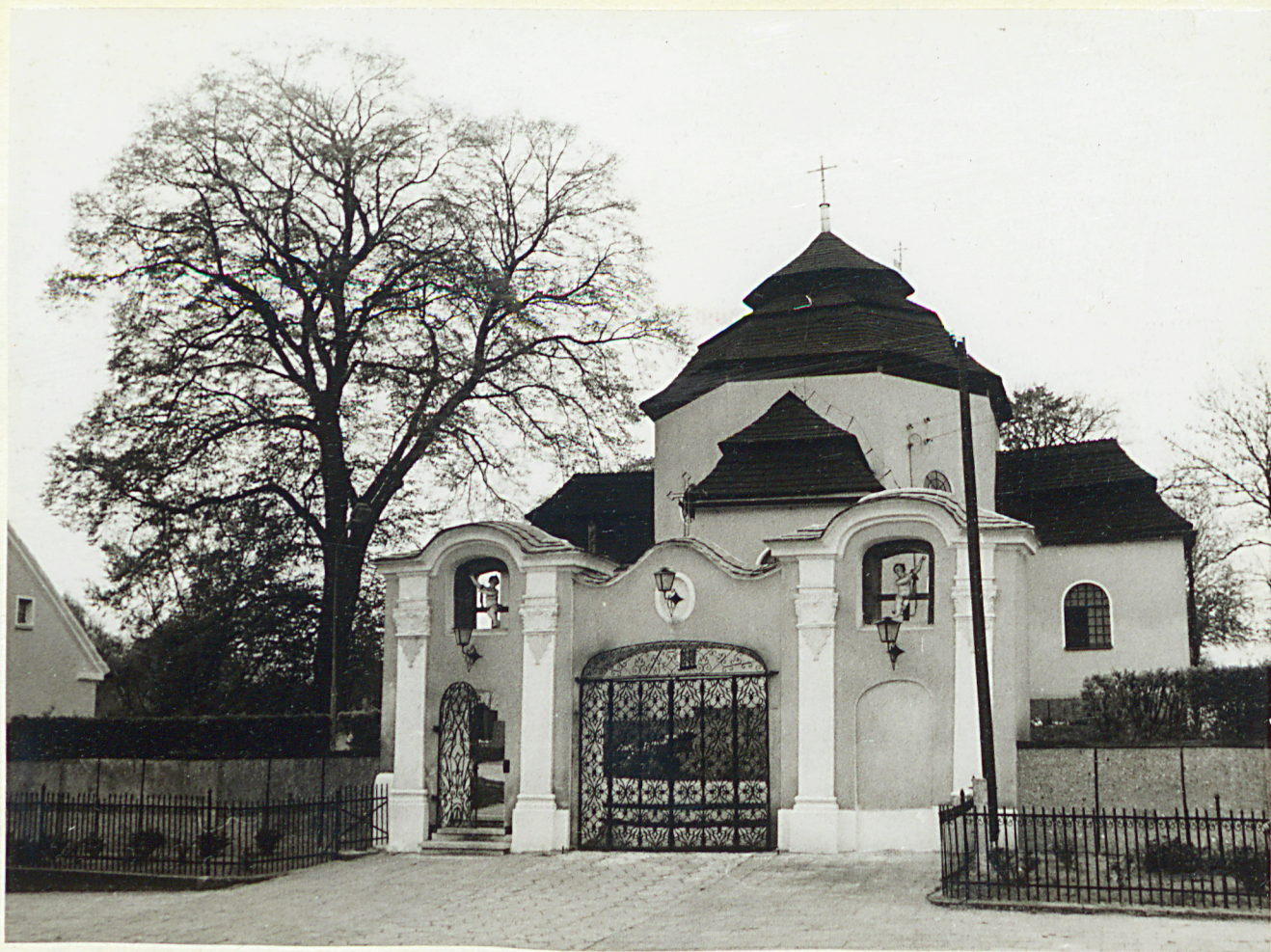
1. Widok na bramę kościoła i cment. od strony szosy.