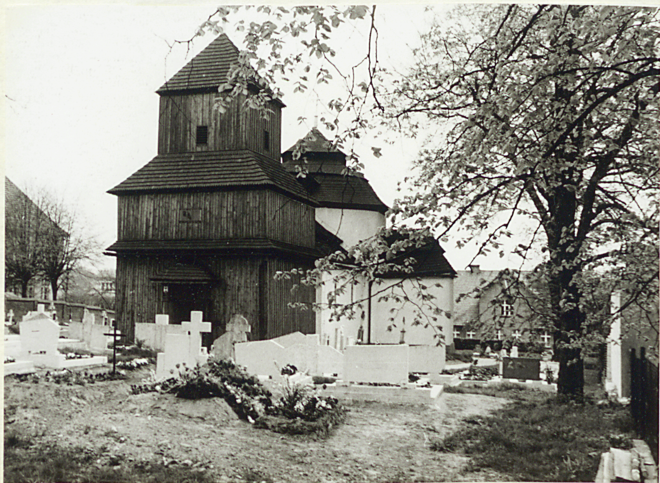
4. Widok na cmentarz i kościół z kw. Pn-zach.