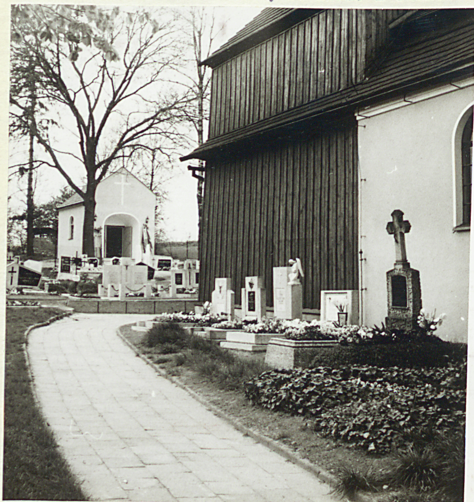
2. Widok na Pn część cment. i kw. przy Bł elewacji k.