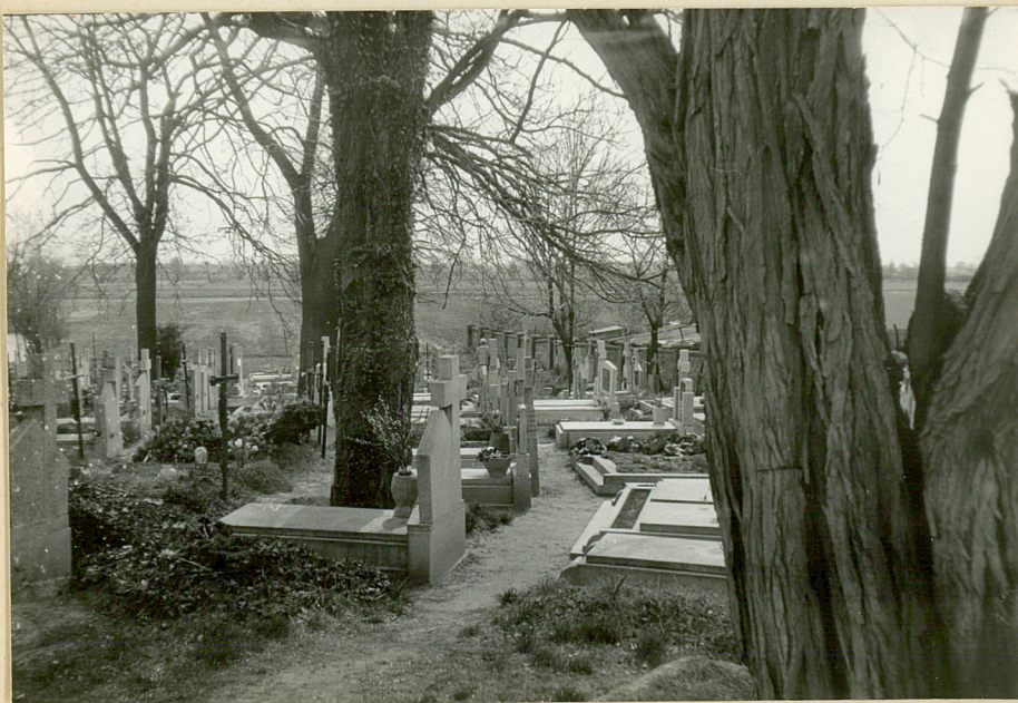
WIDOK PD CZĘŚCI CMENTARZA