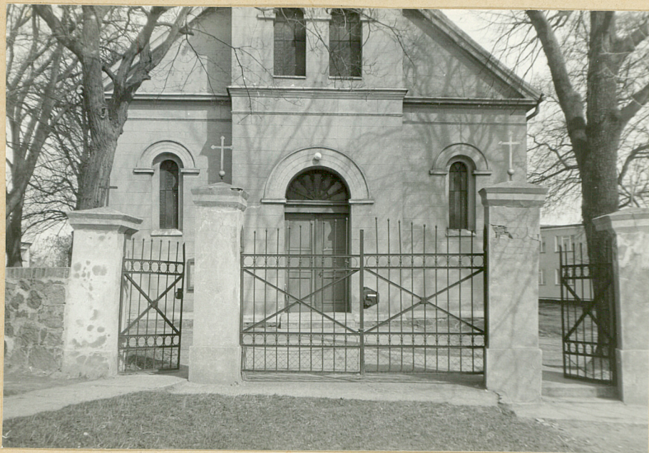
WIDOK OD ZACH.: GŁ. WEJŚCIE I FASADA KOŚCIOŁA