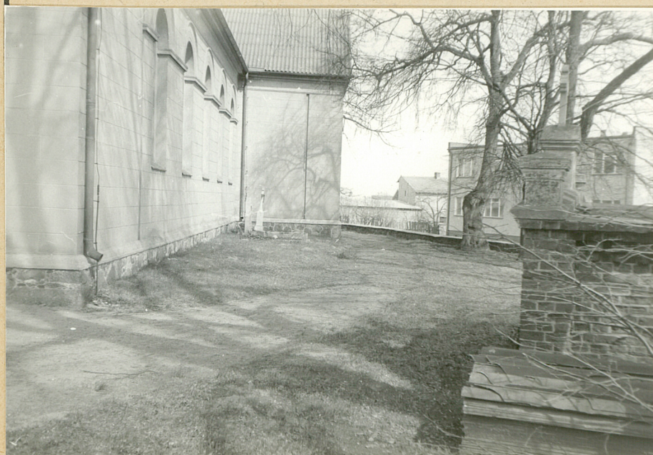
WIDOK OD STRONY PD. NAGROBKI I FRGM. KAPLICY GROBOWEJ.