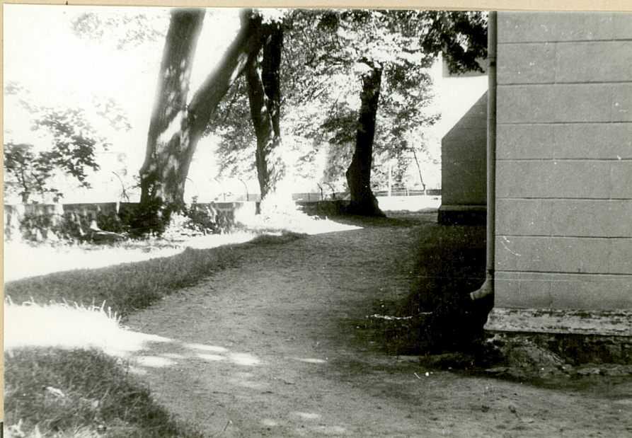
FRAGMENT ALEI OD STRONY PN.