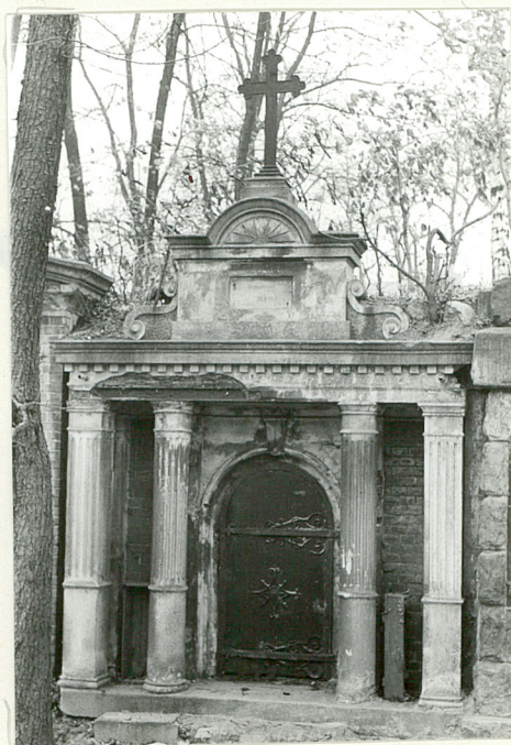
.Grobowiec Rodziny Nowickich- (koniec XIX w.)