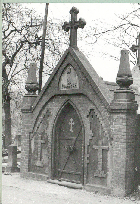
Neoklasycystyczny grobowiec Strykowski - koniec XIX w.