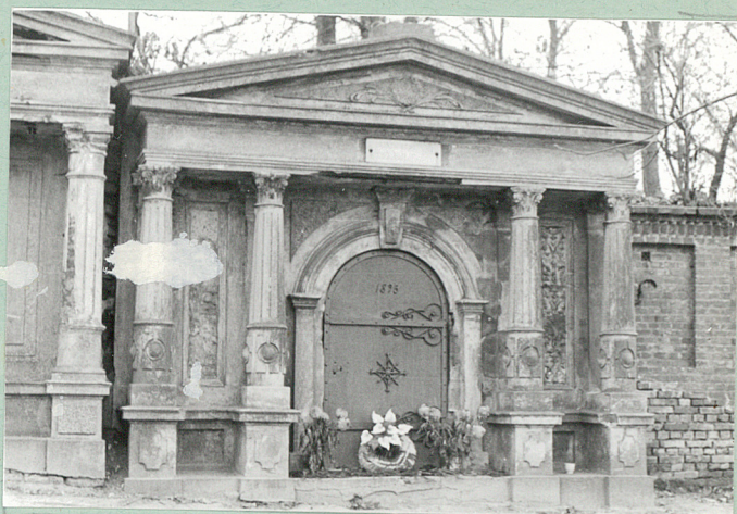
Neoklasycystyczny grobowiec Rodziny Królewczyków (1895 r.)