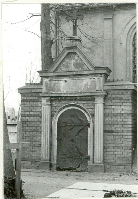
.Grobowiec z 1906 r.