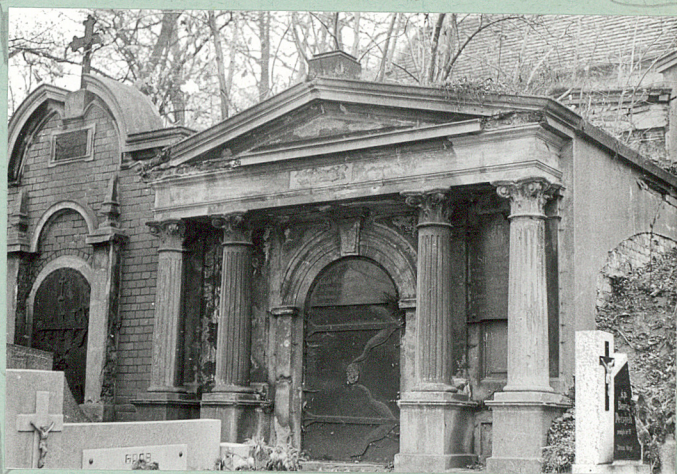
Neogotycki grobowiec Zalewskiego- z końca XIX w.