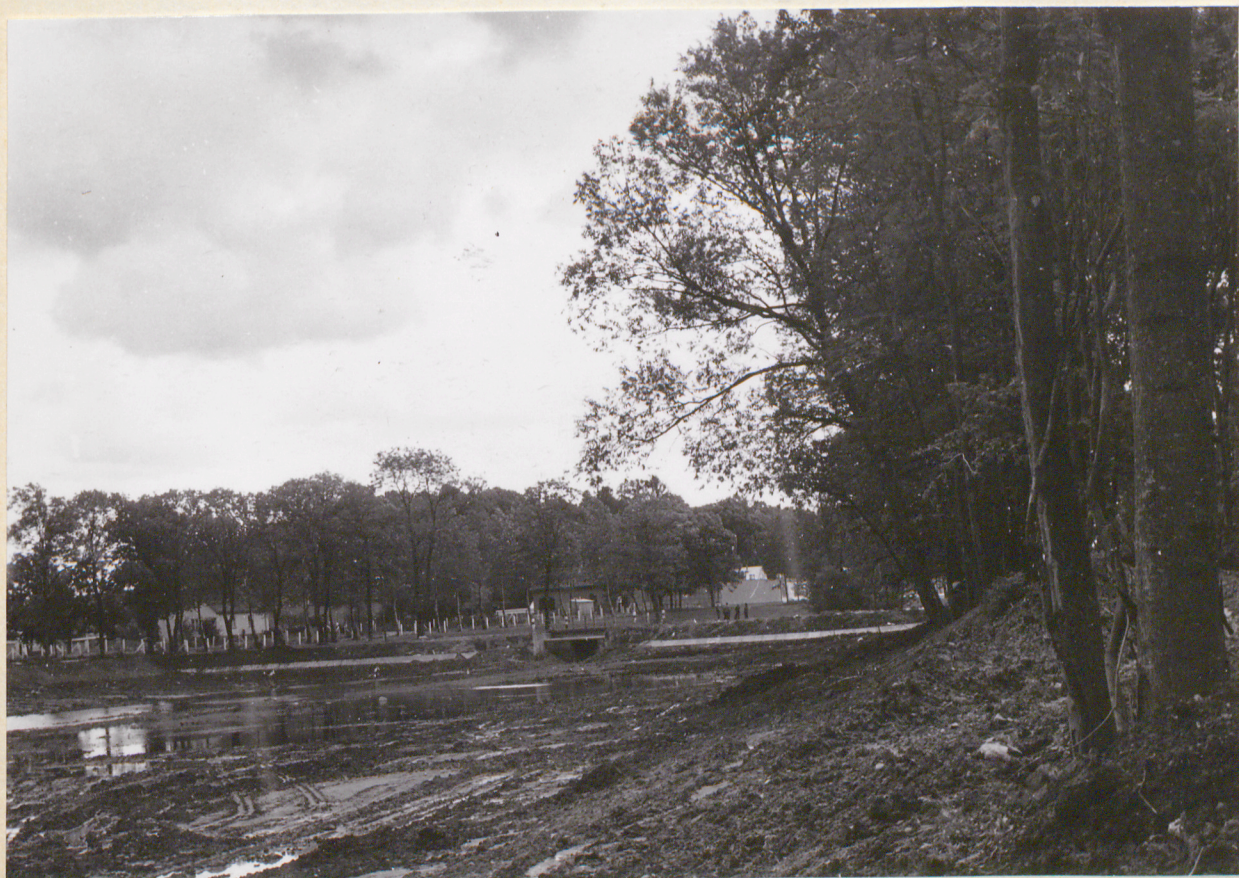
6 neg. 3686