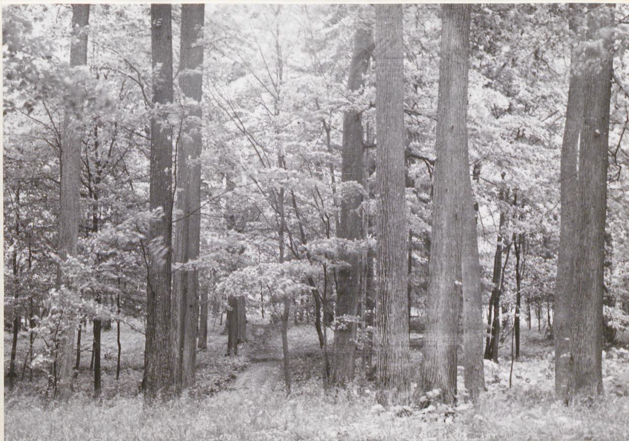
4 neg 3689