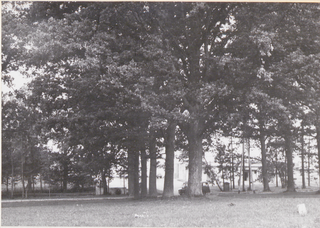
3 neg 3688