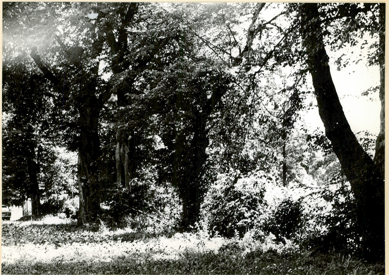
2 neg 3612