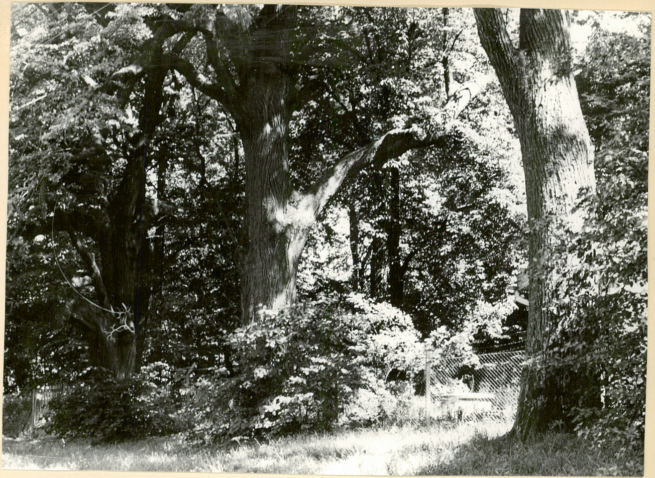
1 neg 3613