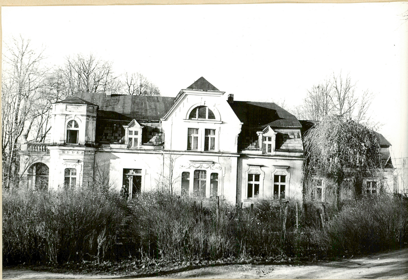
Nr neg. Pałacyk w Nagórkach. Stan obecny.