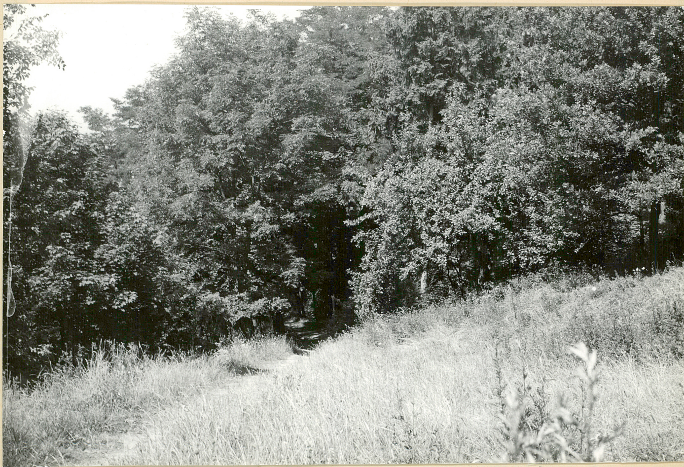
Nr neg. 4130. Fragment parku w Nagórkach.