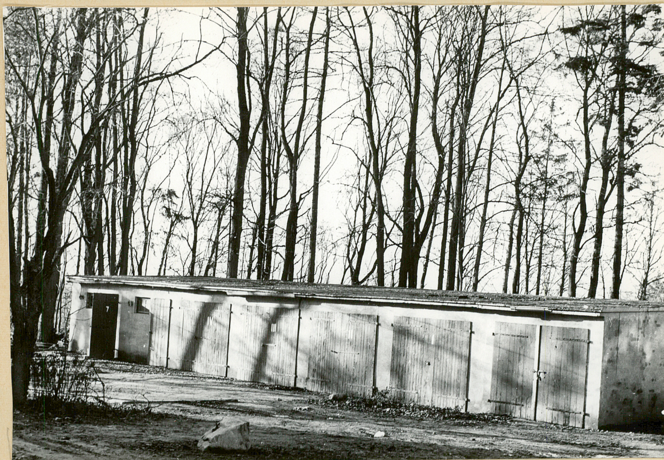
Nr neg. Składy i garaże wzniesione w parku.