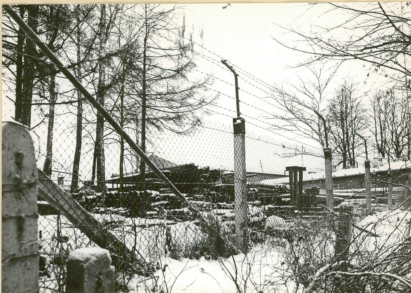
Nr neg. Część parku użytkowana przez PBRol.