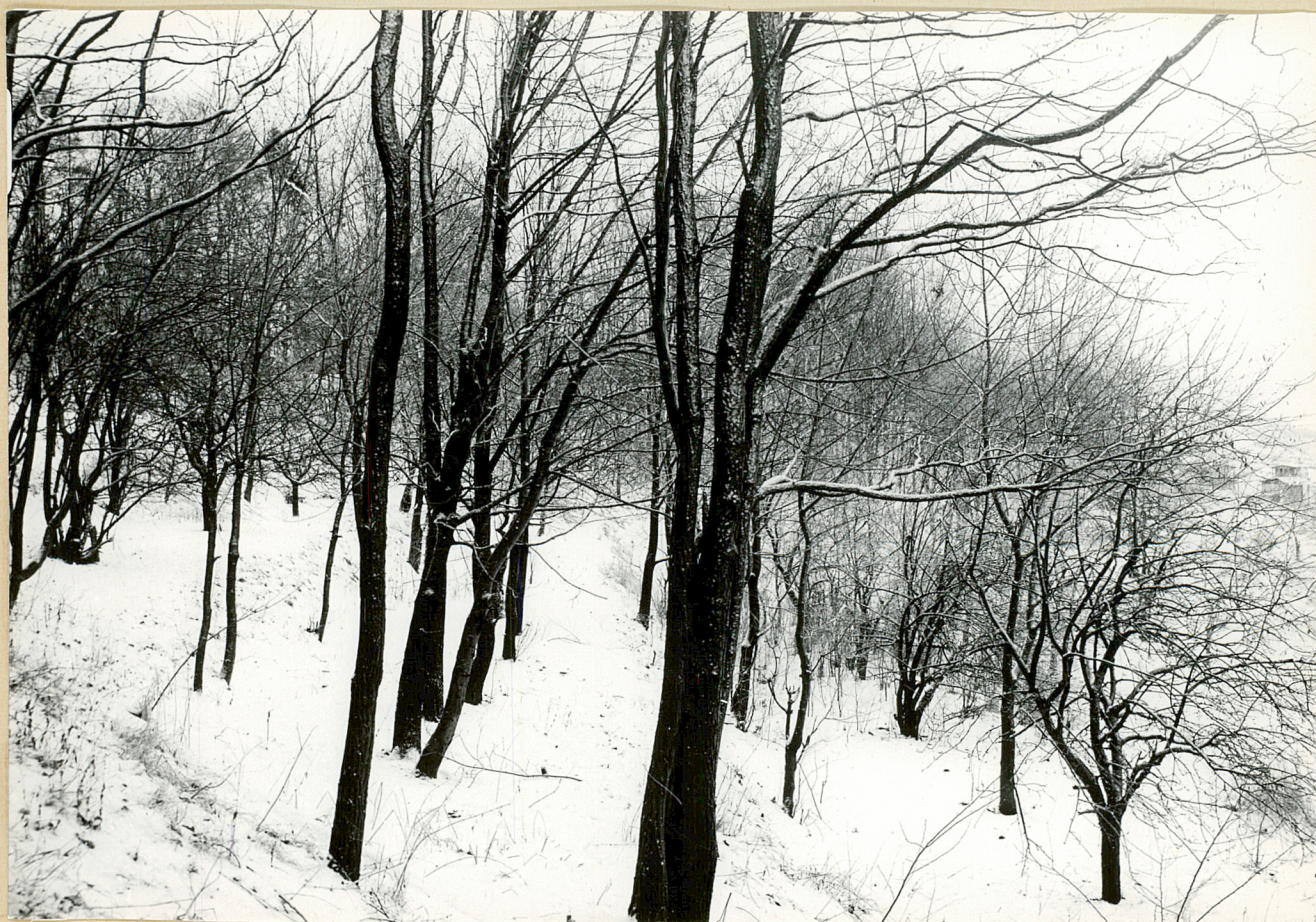
Nr neg. Nasadzenia na tarasach.