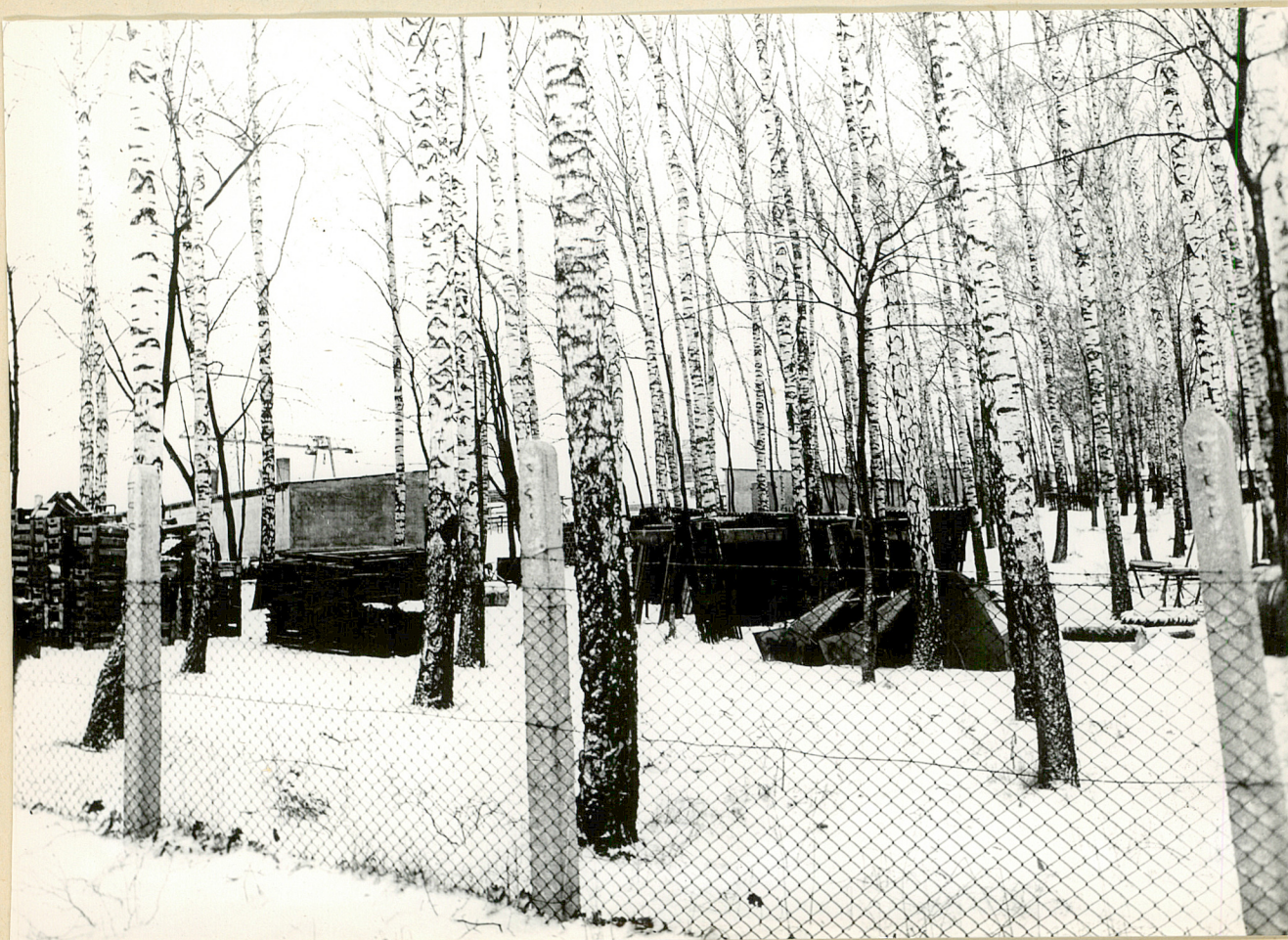
Nr neg. Część parku użytkowana przez PBRol.