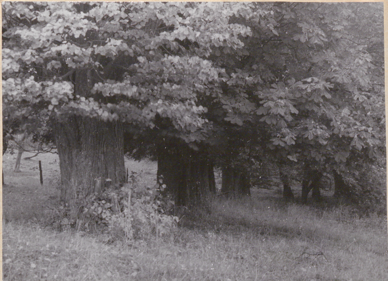
Nr neg. 4044. Szpaler starych lip i kasztanowców.