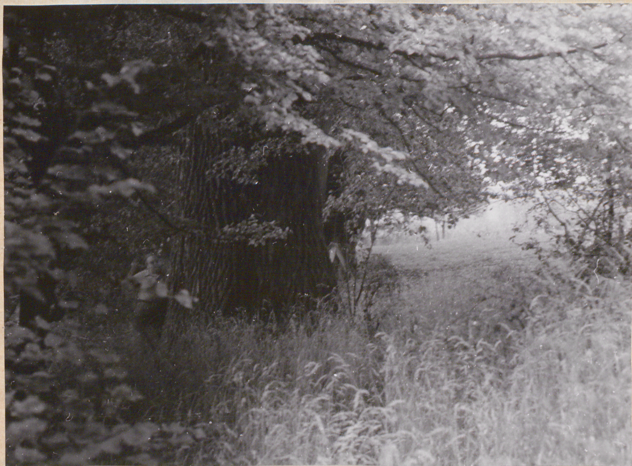
Nr neg. 4037. Pomnikowy dąb o obw. 5,80 m.