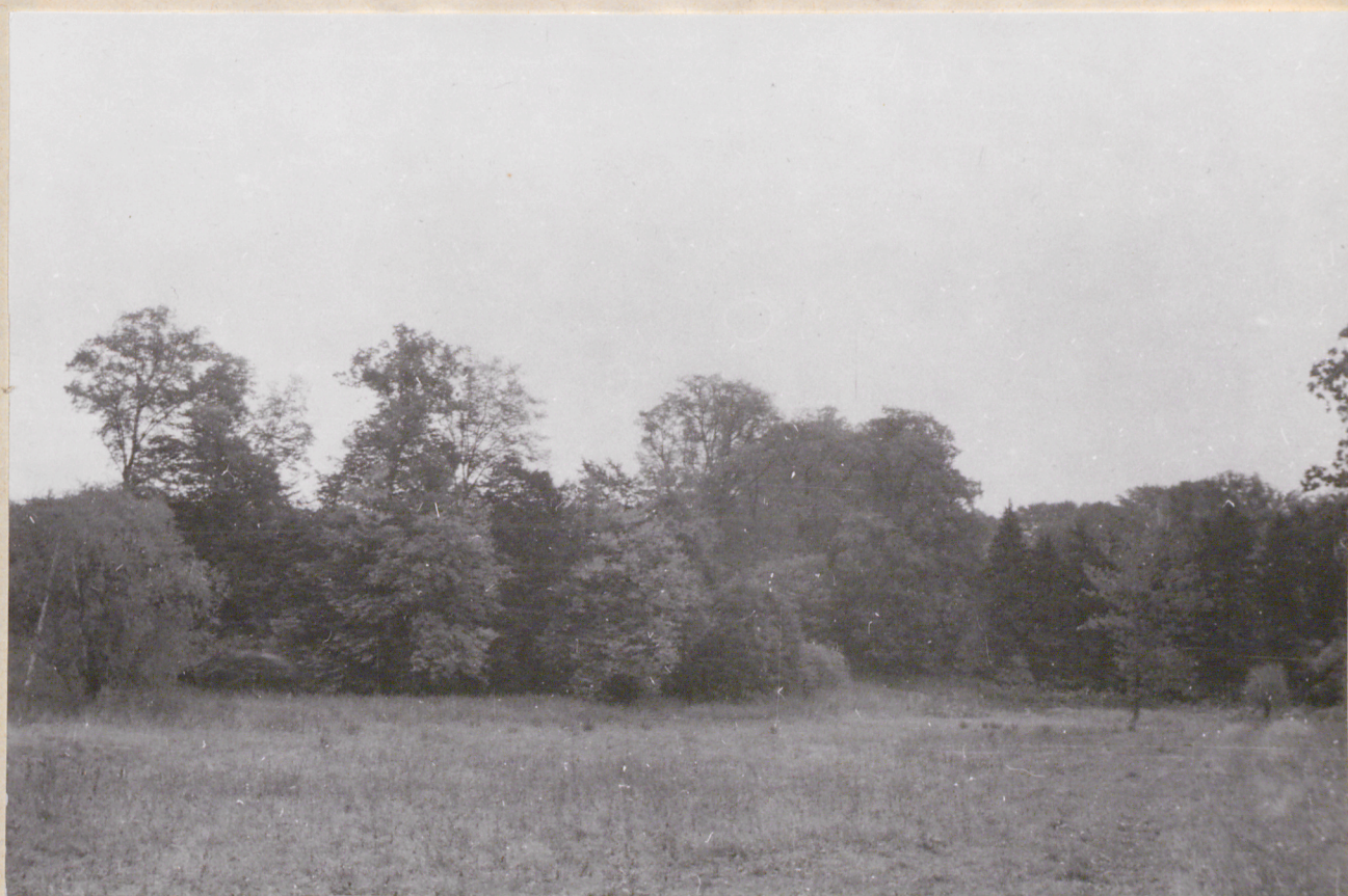
Nr neg. 4043. Park. Widok od strony zachodniej.