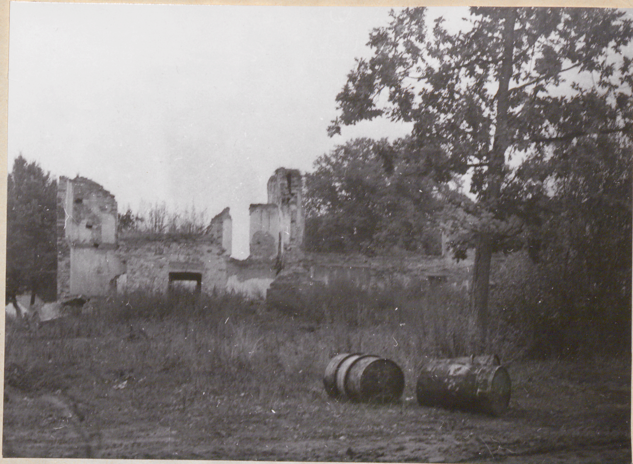
Nr neg. 4034. Ruiny pałacu.