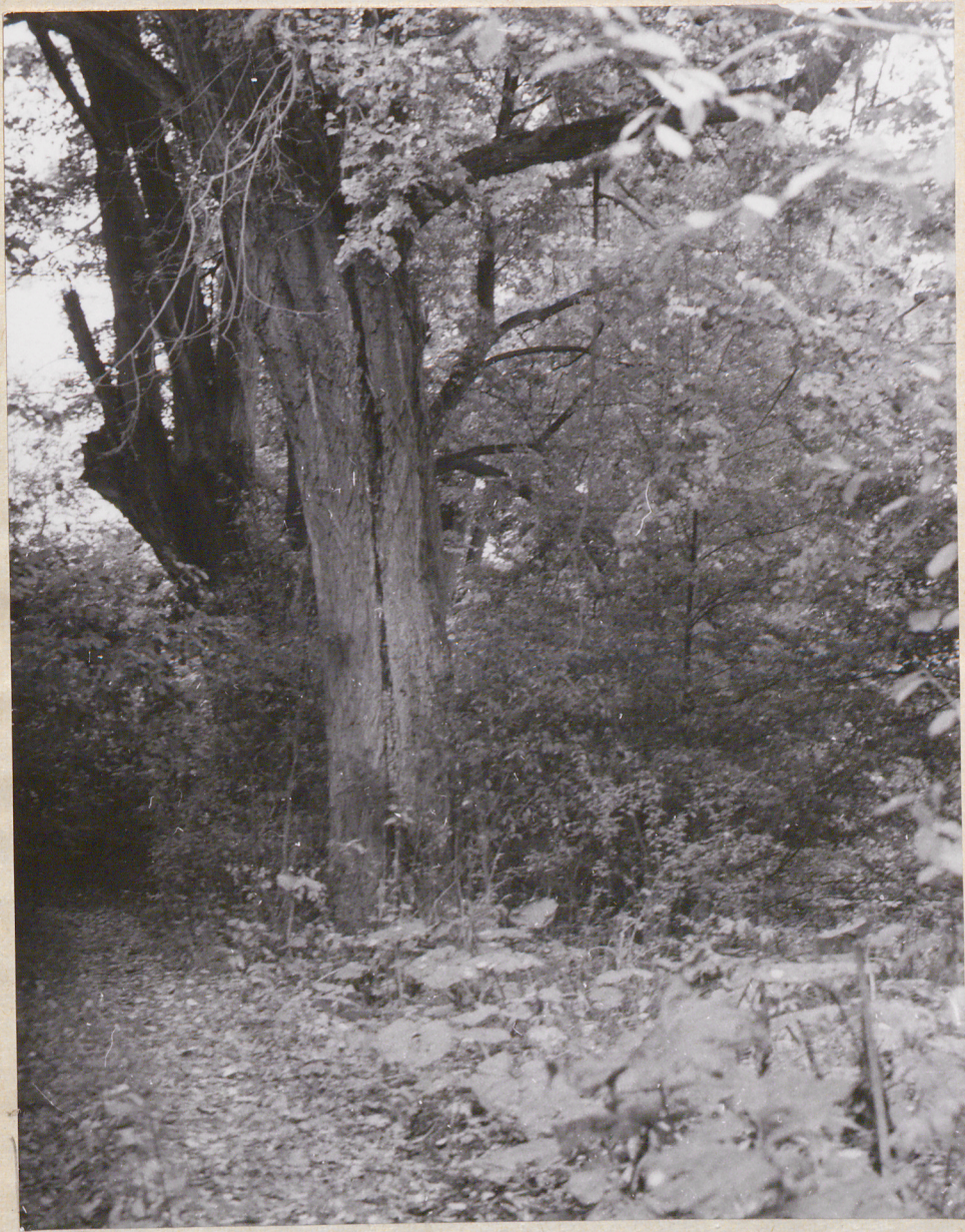
h 38 Nr neg. 4038. Sasiny. Stare lipy w parku.