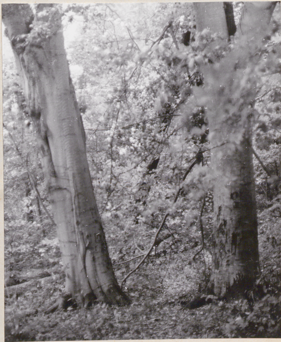
Nr neg. 4035. Buki o obwodzie 2,50 i 2,70 m.