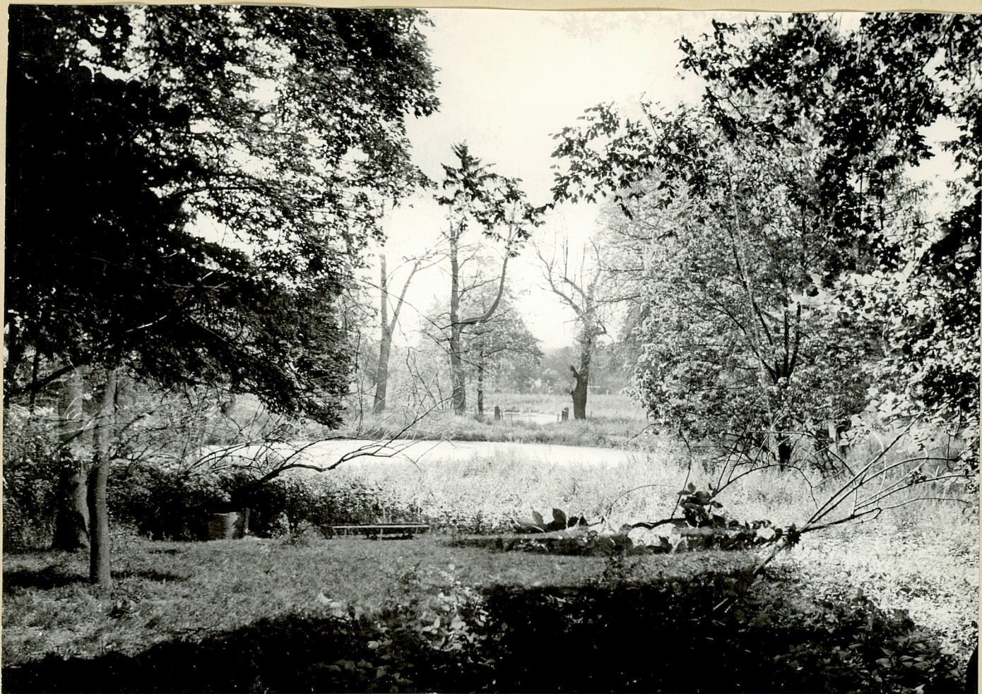
Nr neg. 3793. Podmokła część parku z usychającymi drzewami.