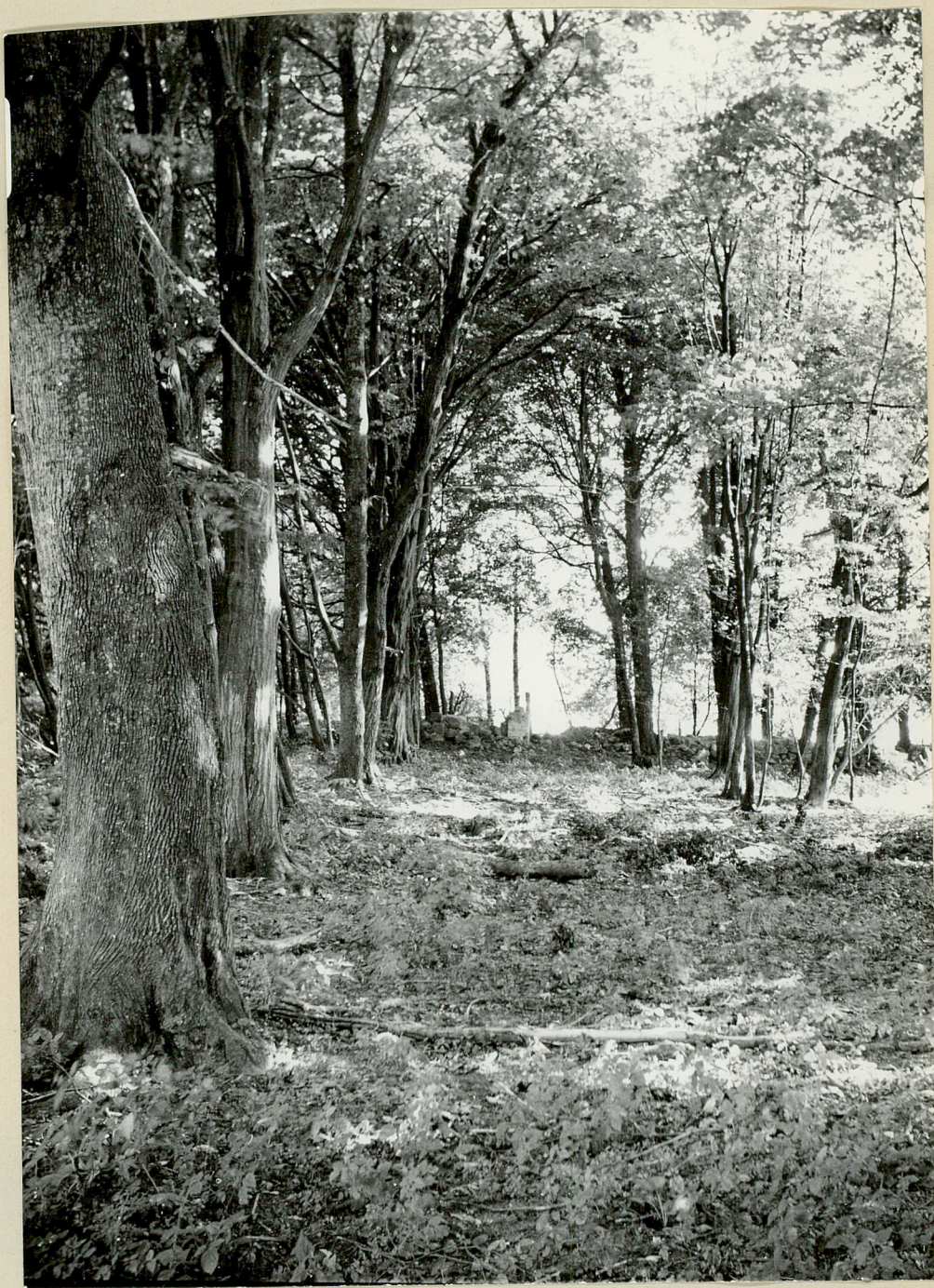
Nr neg. 3799. Szpaler grabowy prowadzący do cmentarzyka.