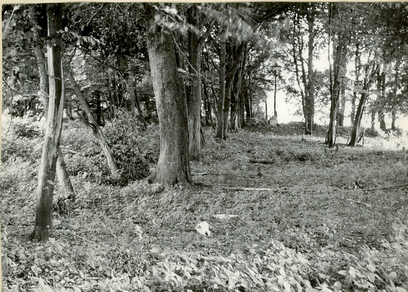
Nr neg. 3800. Aleja lipowo-grabowa.