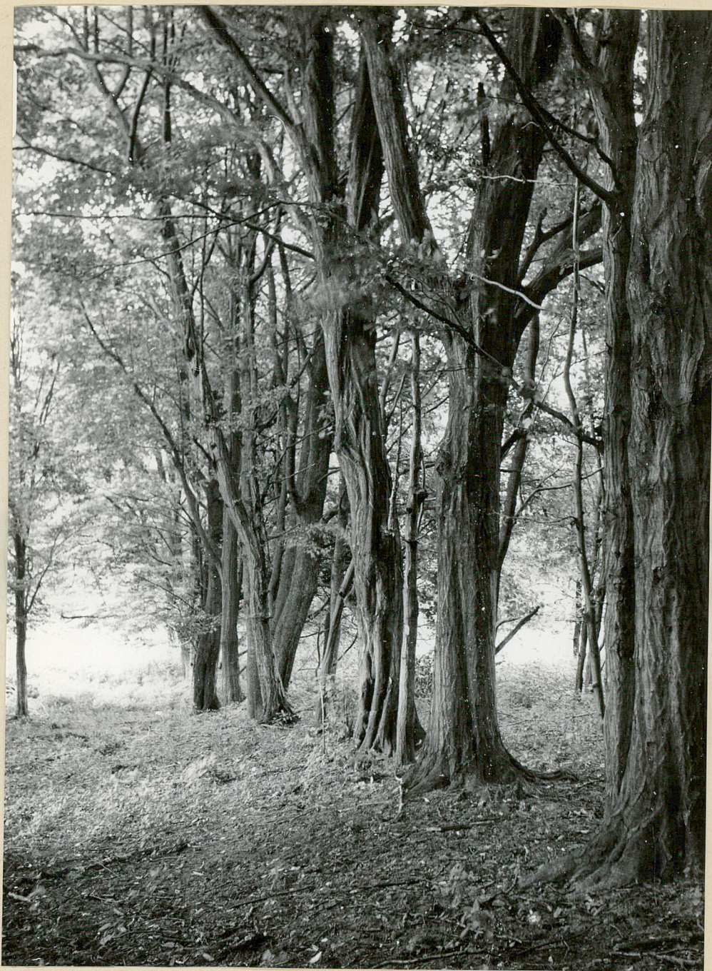
Nr neg. 3798. Szpaler grabowy w parku.