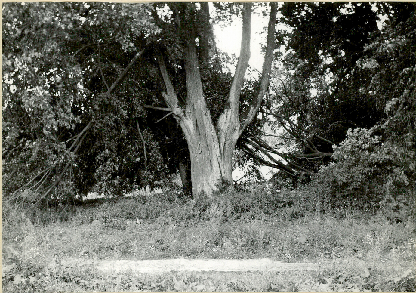
Nr neg. 3801. Lipa o obwodzie 5,20 m ze złamanym konarem.