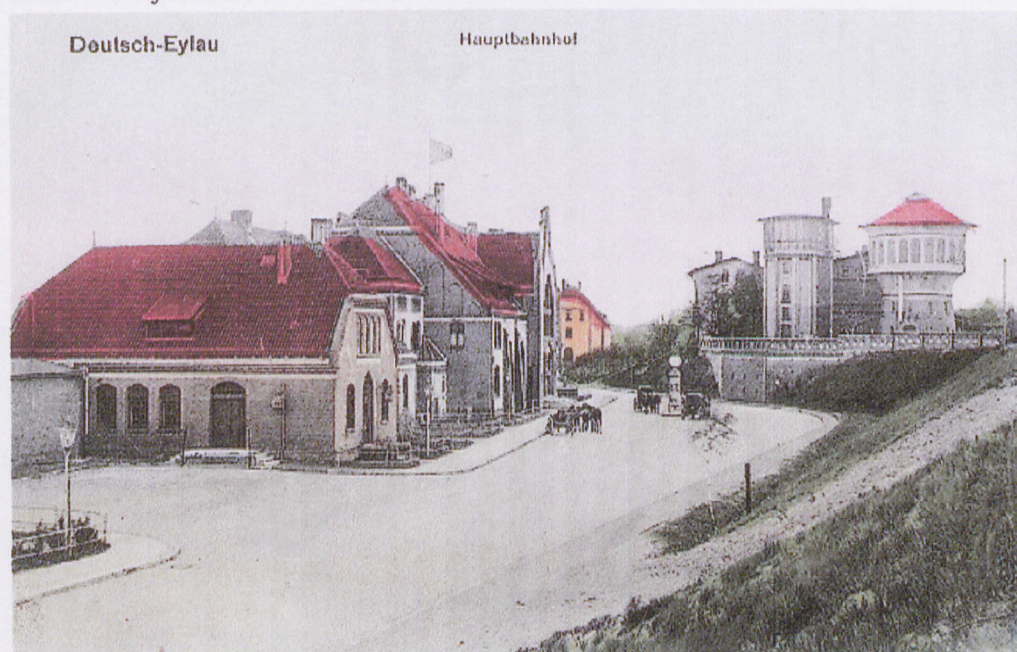
I. Zdjęcie archiwalne, 1915 r.

Po II wojnie światowej do miasta zaczęli napływać nowi mieszkańcy, przede wszystkim kolejarze, którzy wnieśli ogromny wkład w odbudowę stacji i miasta (w 1948 roku stanowili oni 1/3 populacji Iławy). Istnienie ważnego węzła kolejowego zadecydowało również o przeniesieniu po wojnie do Iławy władz powiatowych, które dotychczas znajdowały się w Suszu. Zarówno ruch pasażerski jak i towarowy był i jest bardzo duży (szacuje się, że rocznie przez stację Iława Główna przejeżdża ponad 250 tys. pasażerów). Stacja obsługuje całość ruchu towarowego w promieniu kilkudziesięciu kilometrów. Iławski Zakład Taboru obsługuje znaczną część ruchu kolejowego w północnej Polsce. Budynek dworca został wzniesiony w 1905r. w stylu neogotyckim. Halę recepcyjną dworca zdobią herby miast i prowincji wschodniopruskiej. W budynku znajdują się również poczekalnia i restauracja. Z tego samego okresu pochodzą, znajdujące się w pobliżu dworca, wieża wodna i parowozownia. Od niedawna właścicielem budynku jest spółka Polskie Koleje Państwowe Dworce Polskie S.A.