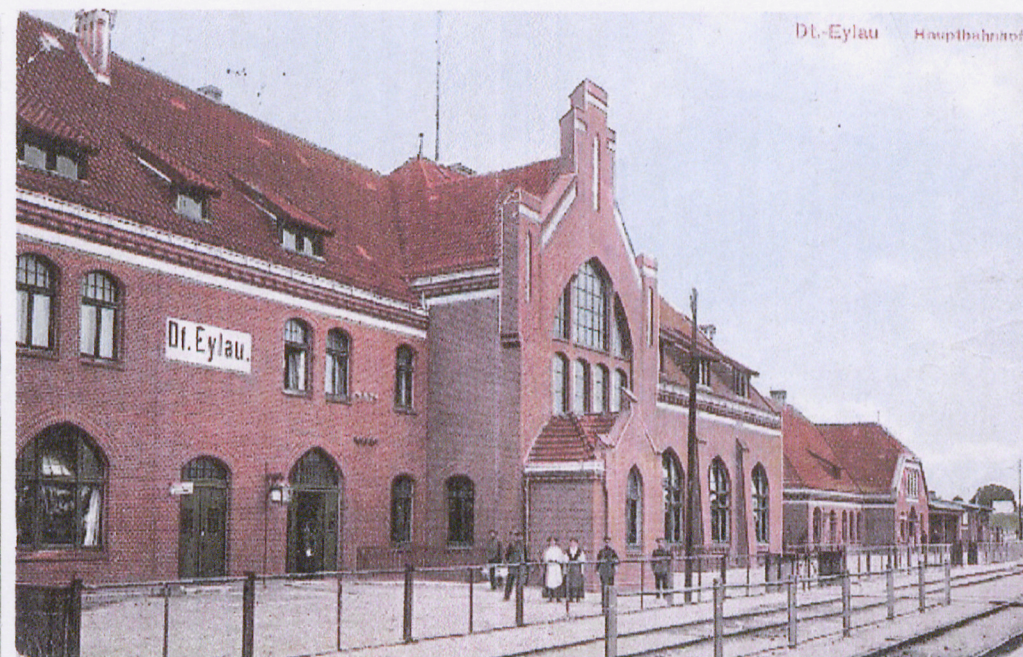
II. Zdjęcie archiwalne