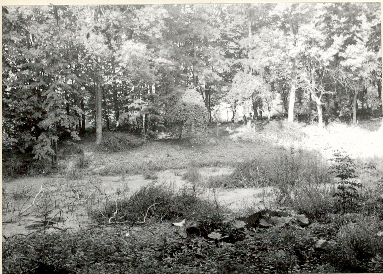
4 neg. 3453