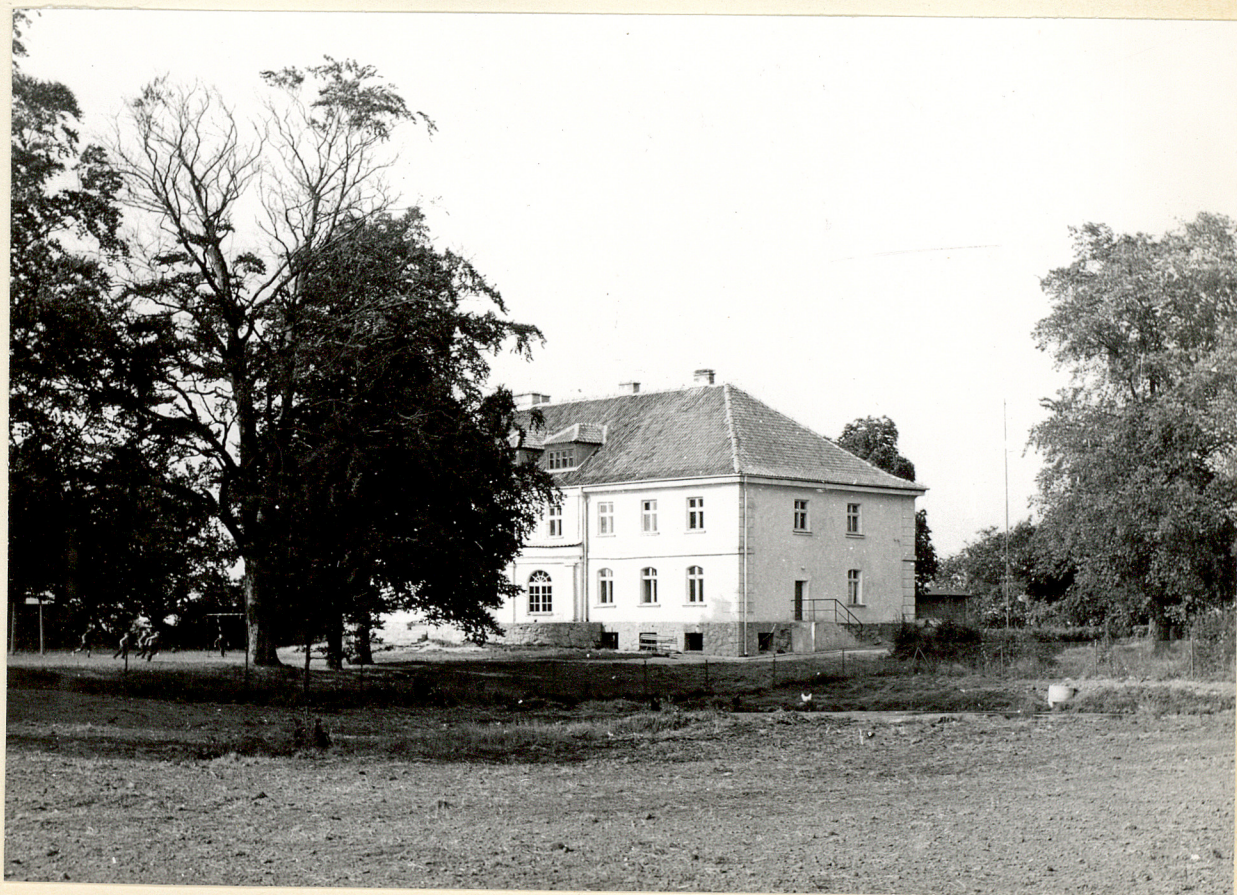
2 neg. 3454