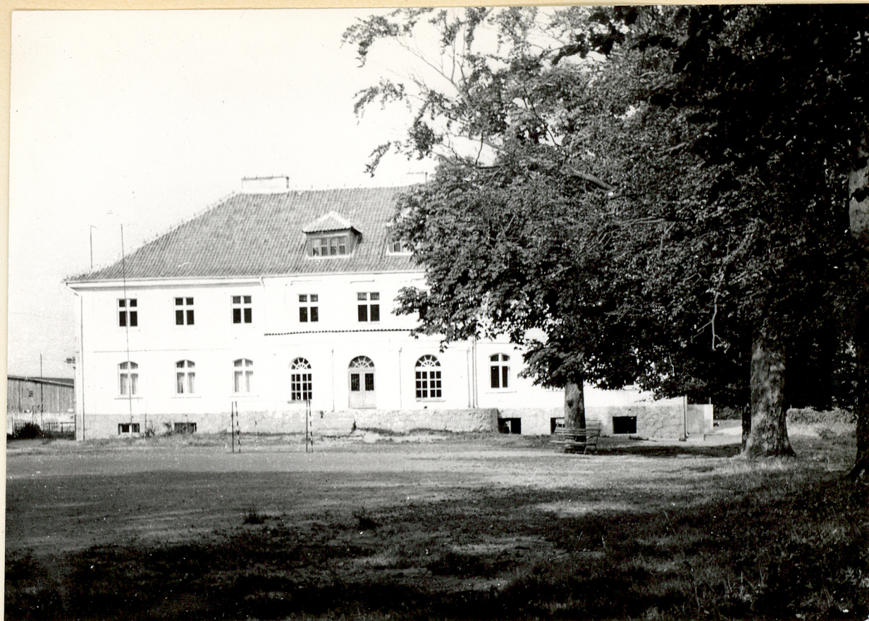
1 neg. 3456