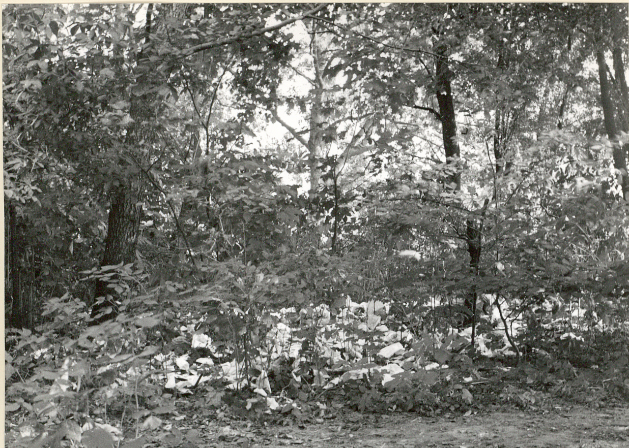
3 neg. 3457