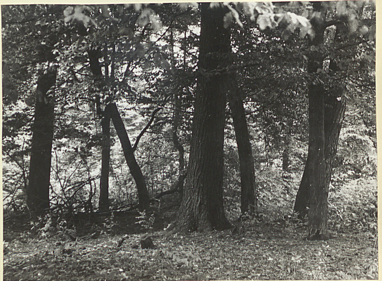
6 neg. 3490