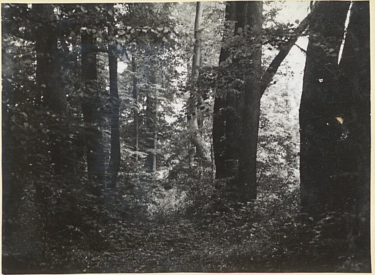
5 neg. 3491