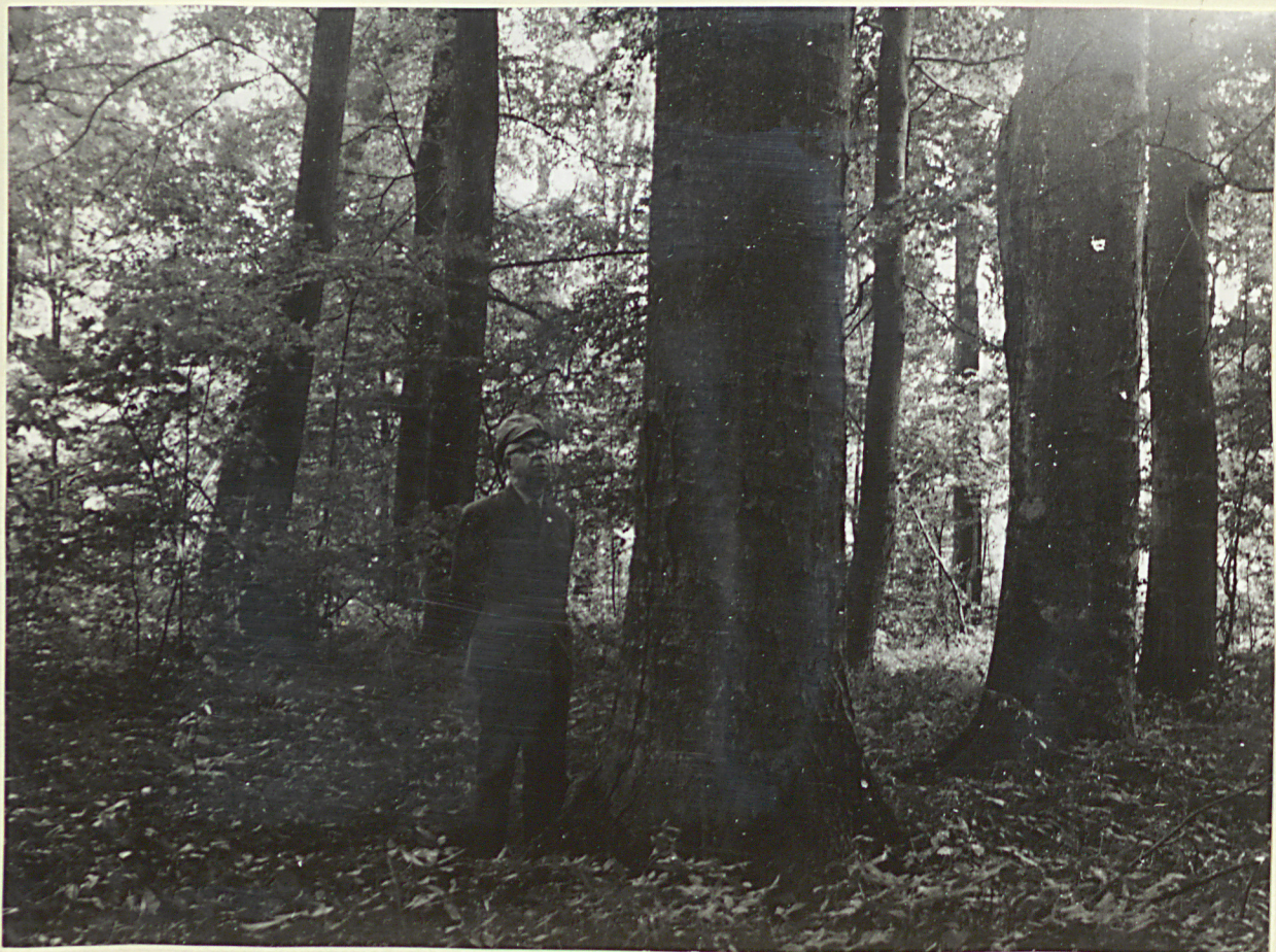
4 neg. 3487