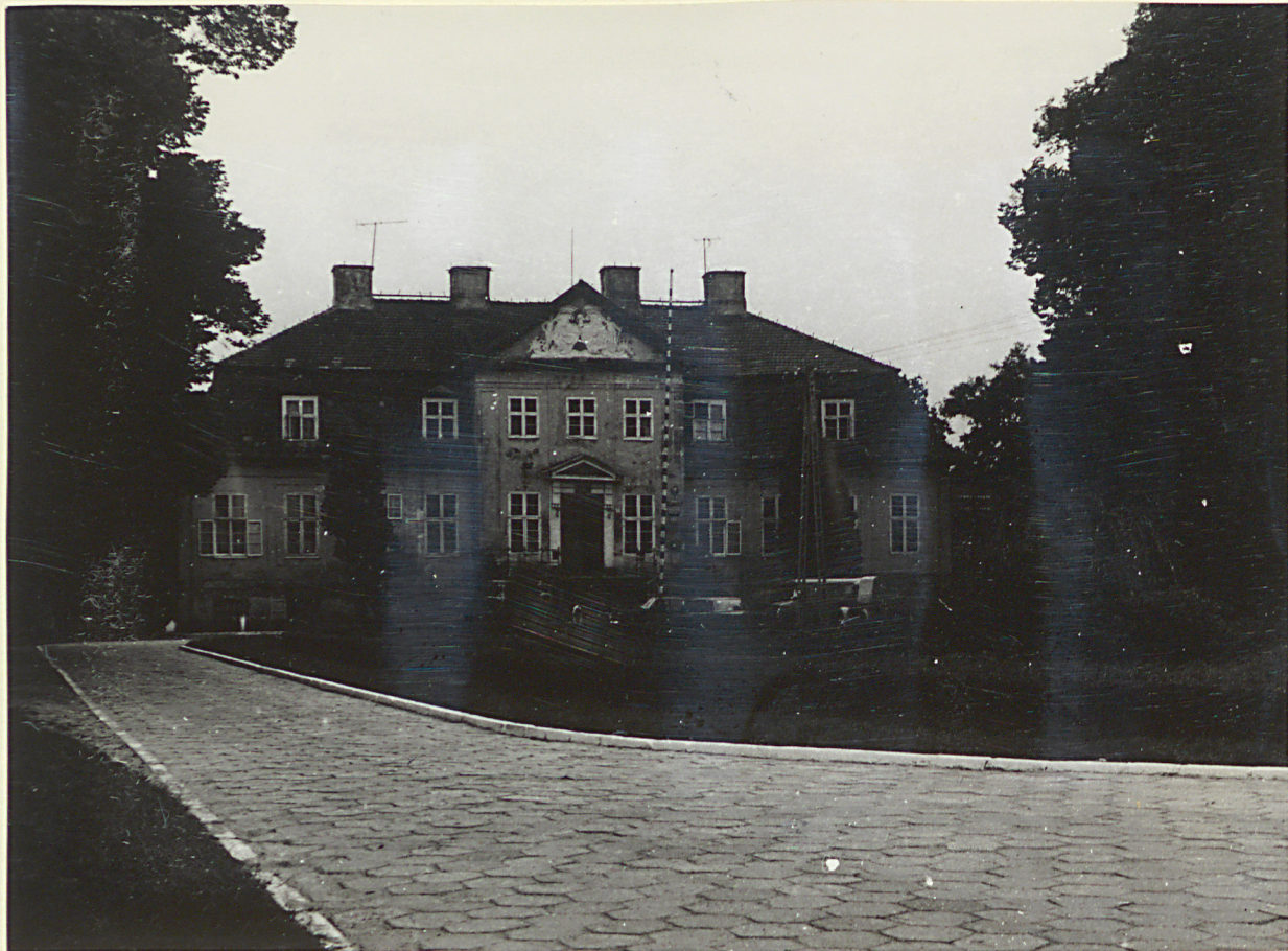
1 neg. 3498