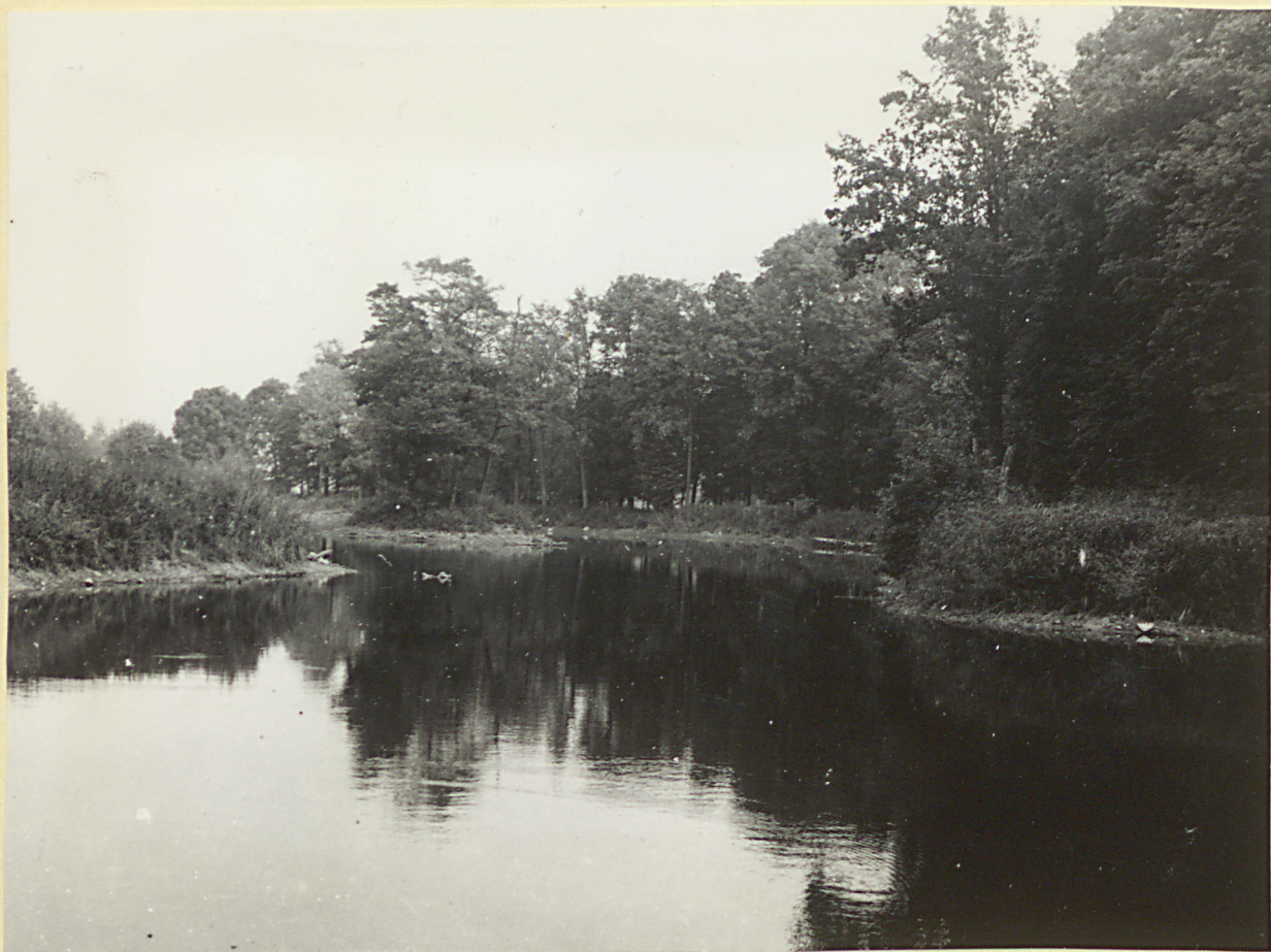
8 neg. 3488