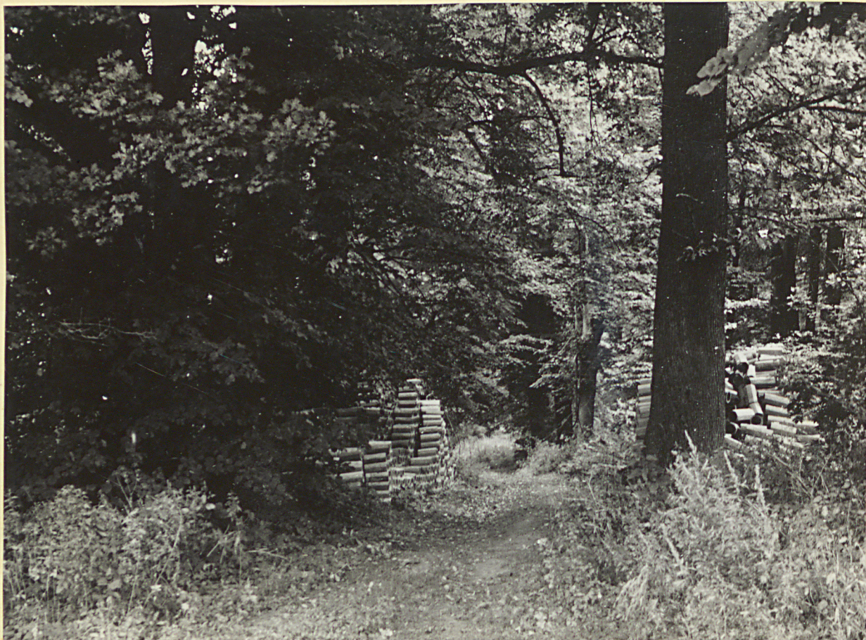
7 neg. 3486