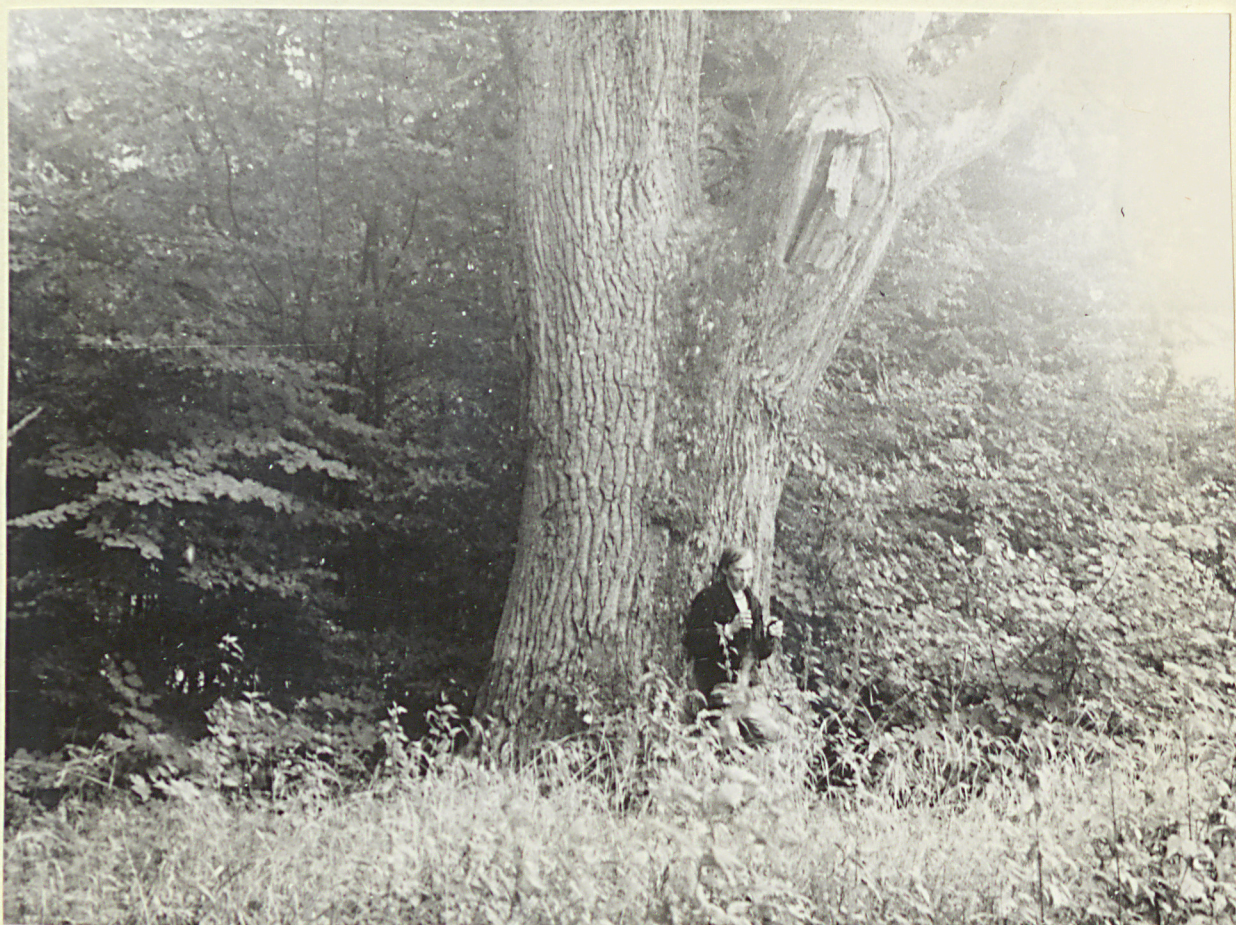
2 neg. 3492