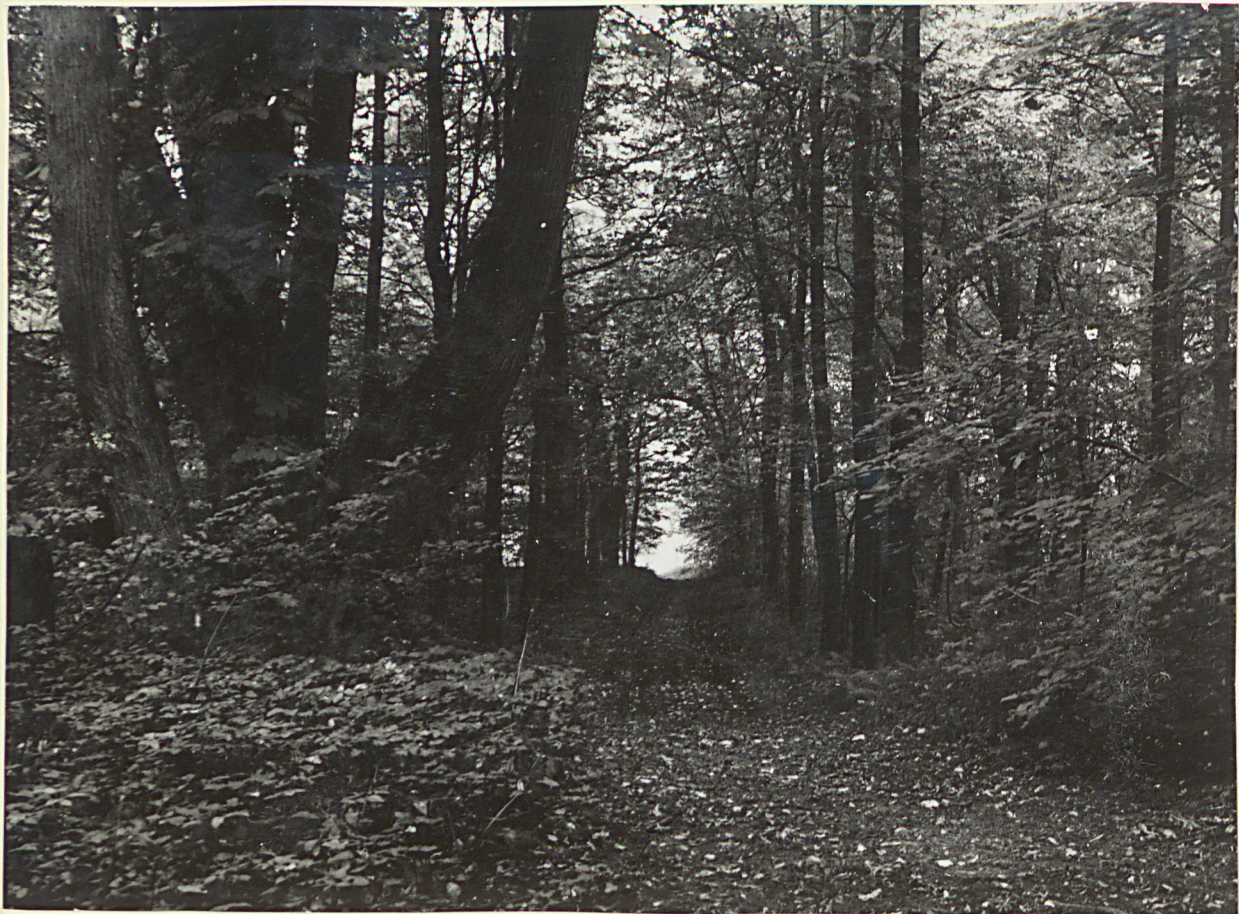
3 neg. 3485