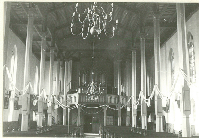
Widok na chór