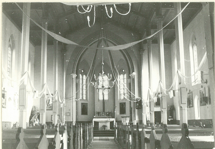
Widok na prezbiterium