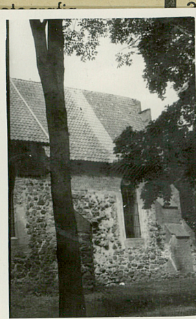
22. Przebieg prac konserwatorskich