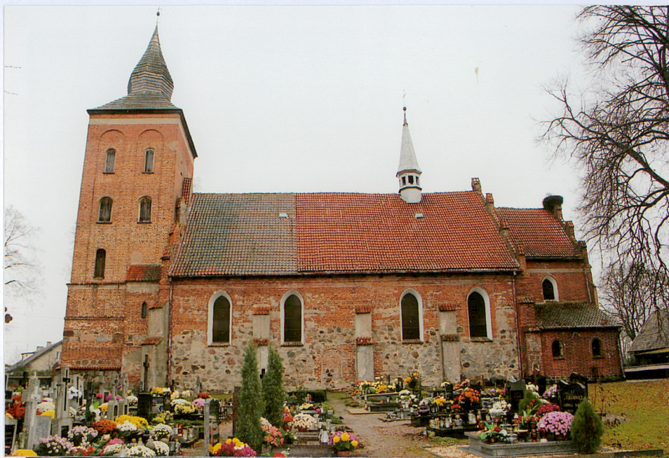
1. elewacja południowa