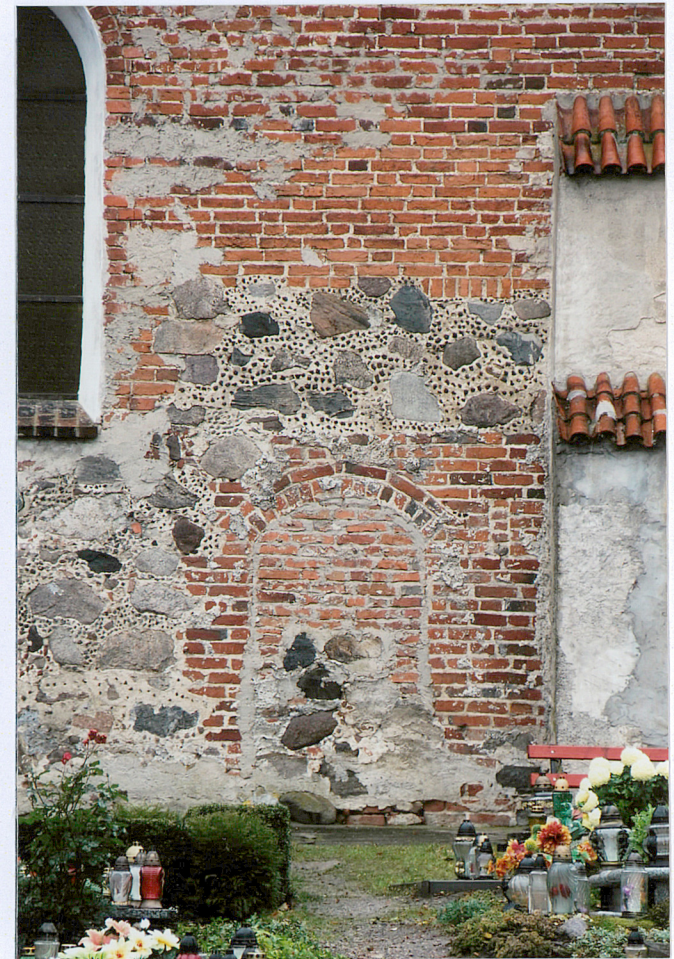
3 detal muru

Opracowanie załącznika mgr inż. arch. Dorota Misiaczyk-Struzik (data i podpis) listopad 2012