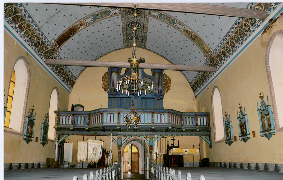
4 wewnątrz- widok na chór muzyczny