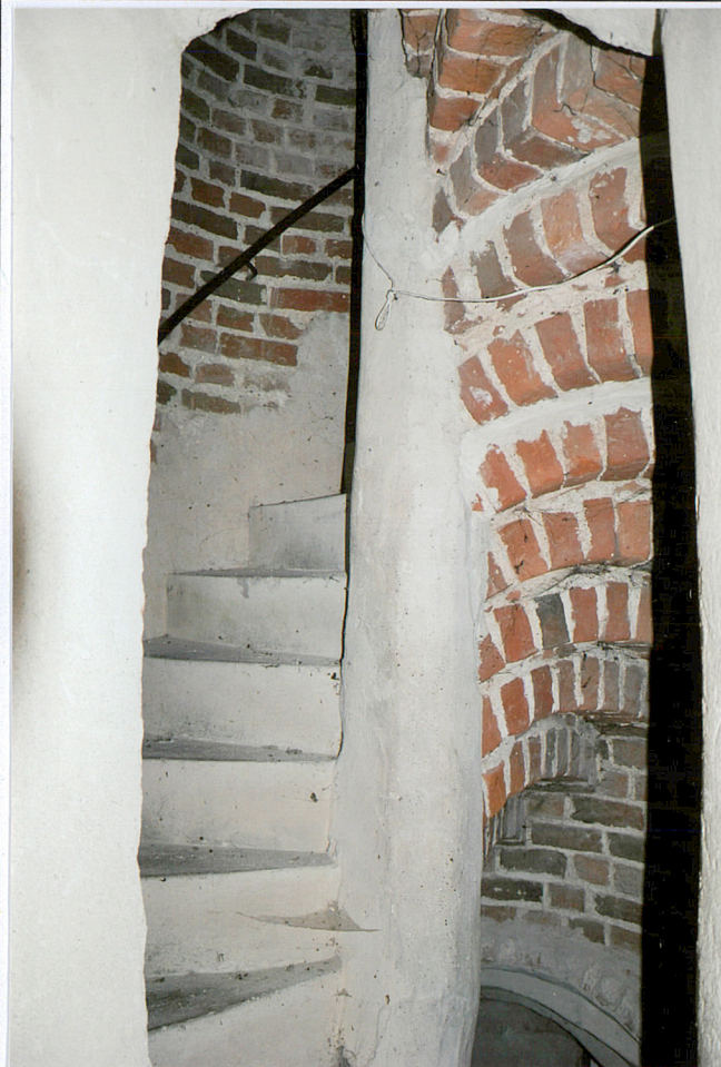
1. elewacja zachodnia