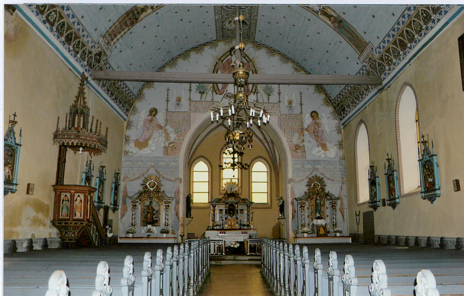
3 wewnątrz – widok na prezbiterium