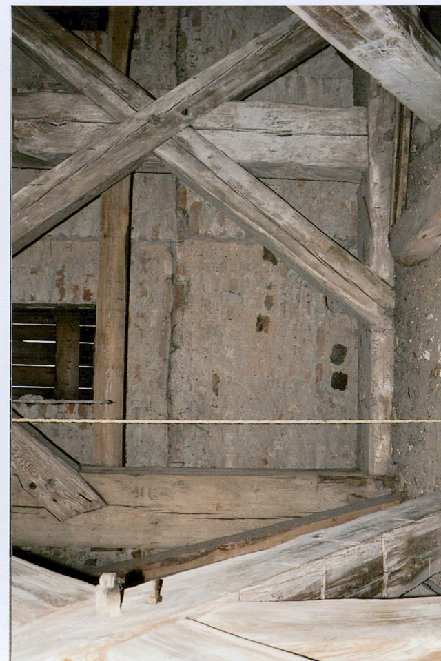
3. konstrukcja drewniana wieży – krzyże św Andrzeja