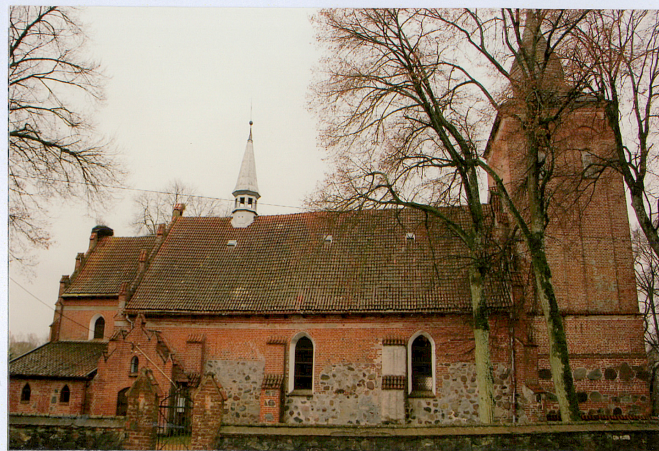
2 elewacja północna