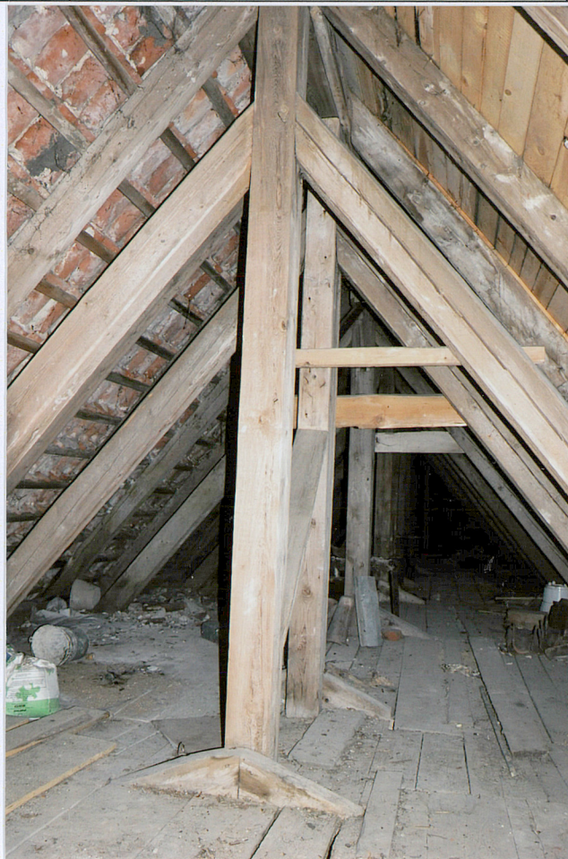
2. elewacja wschodnia