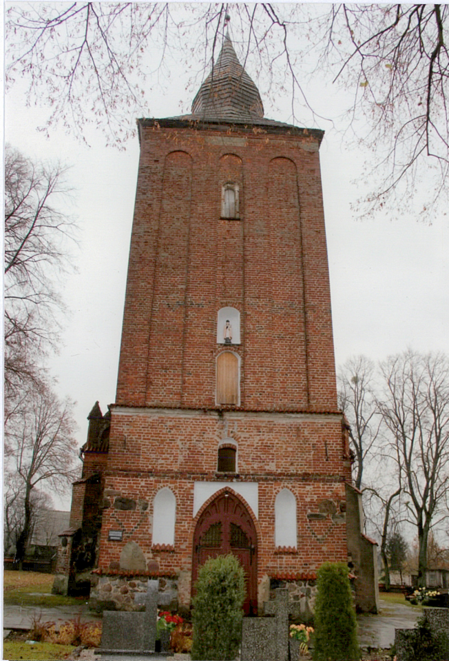
1. elewacja zachodnia