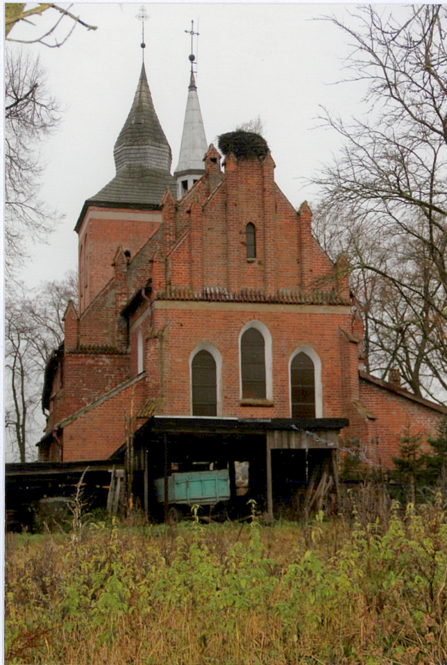
2. elewacja wschodnia