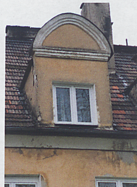
Lukarna w elewacji wschodniej