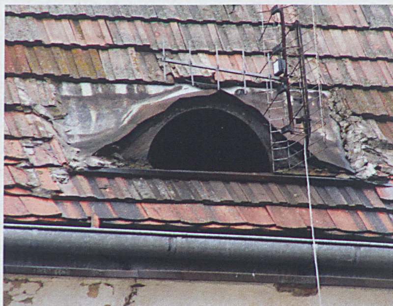
Wole oko a