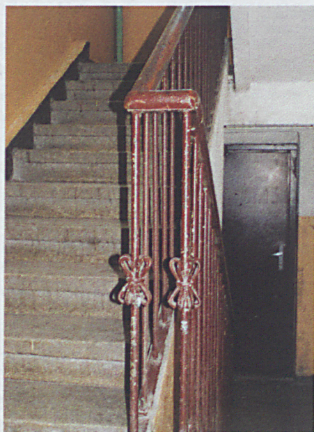
Poręcze klatki schodowej