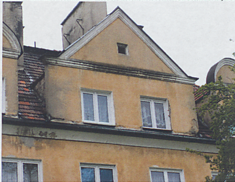
Facjata elewacji wschodniej