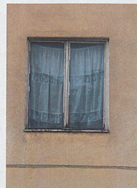
Otwór okienny – elewacja zachodnia