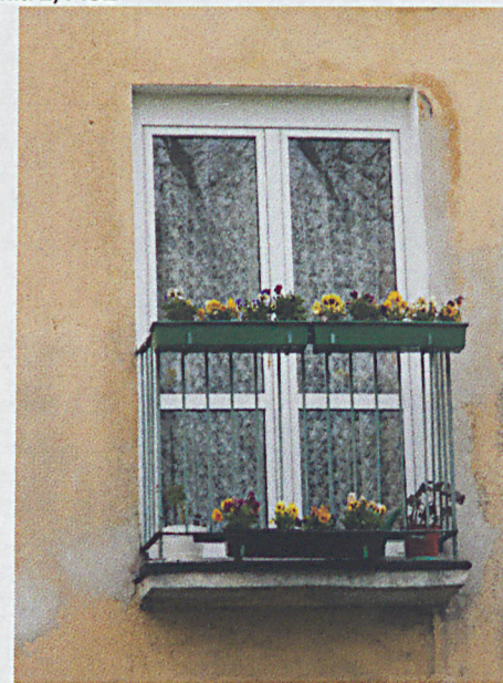
Otwór balkonowy – elewacja wschodnia