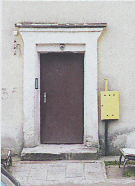
Otwór drzwiowy – elewacja zachodnia