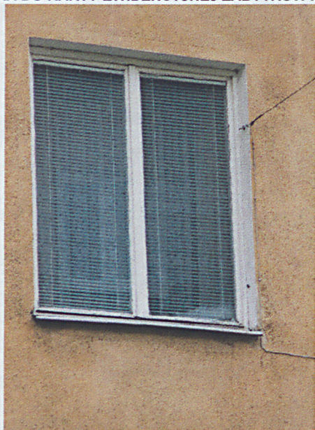
Otwór okienny elewacji północnej