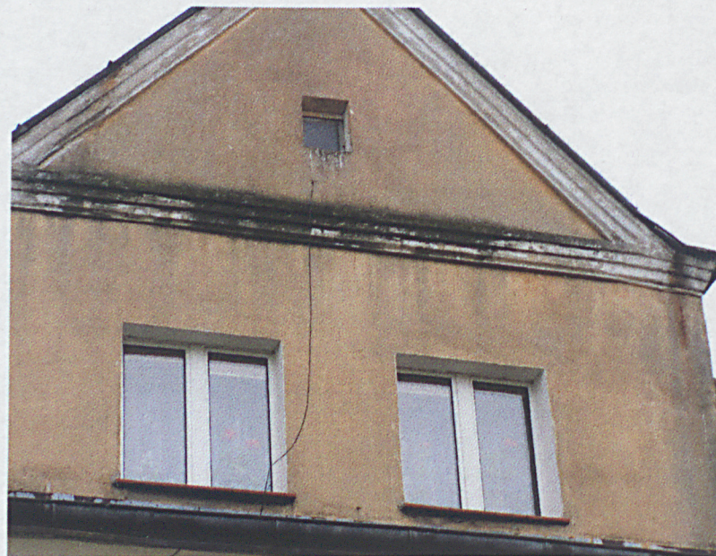
Facjata elewacji północnej