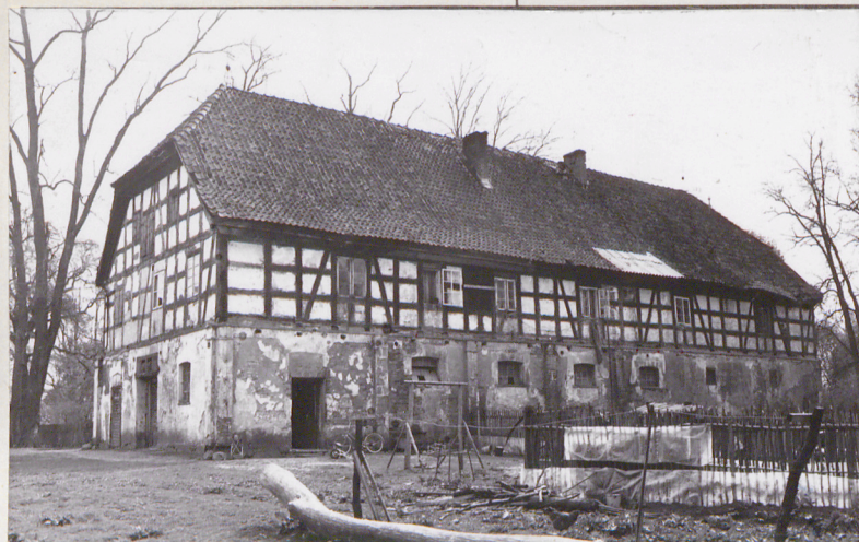
Elewacja pn., stan z 1983r.

3. Zawartość wkładki (nazwa obiektu lub materiału uzupełniającego) Mapa parku i zdjęcia stanu z 1983r. i 1990r.