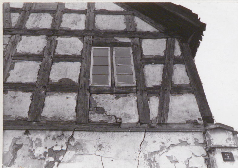
Narożnik elewacji front., stan z 1983r.