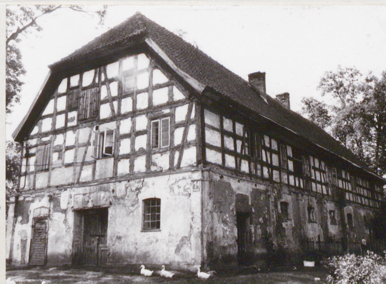
Elewacja frontowa i pn. stan z 1990r.