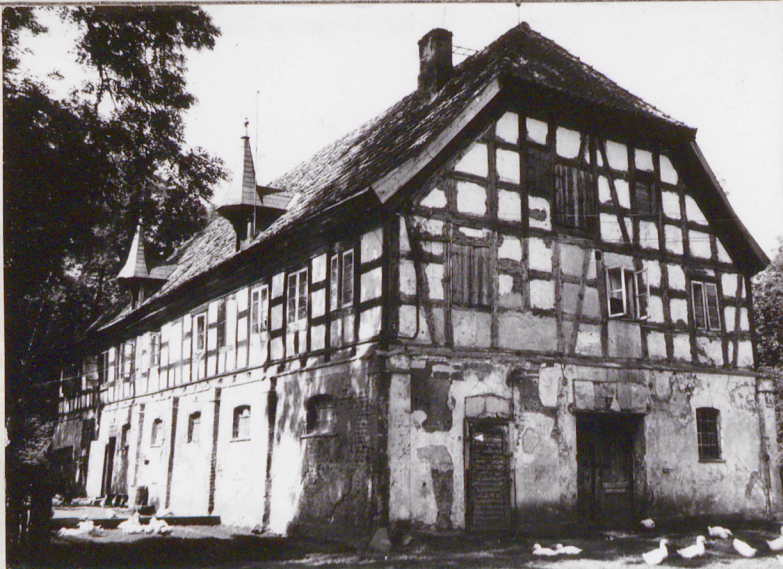
Elewacja frontowa, stan z 1990r.