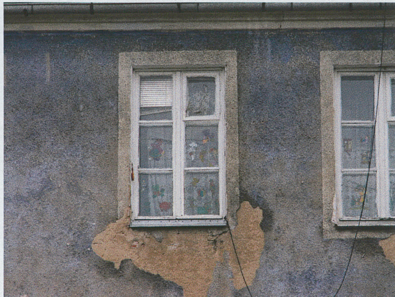
Otwór okienny na II kondygnacji – elewacja wschodnia (b)