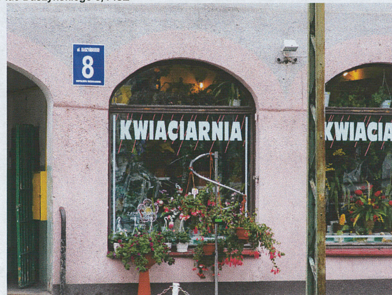
Otwór okienny na I kondygnacji – elewacja zachodnia