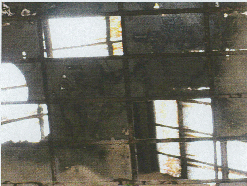
Doświetlenie klatki schodowej – przeszklony dach