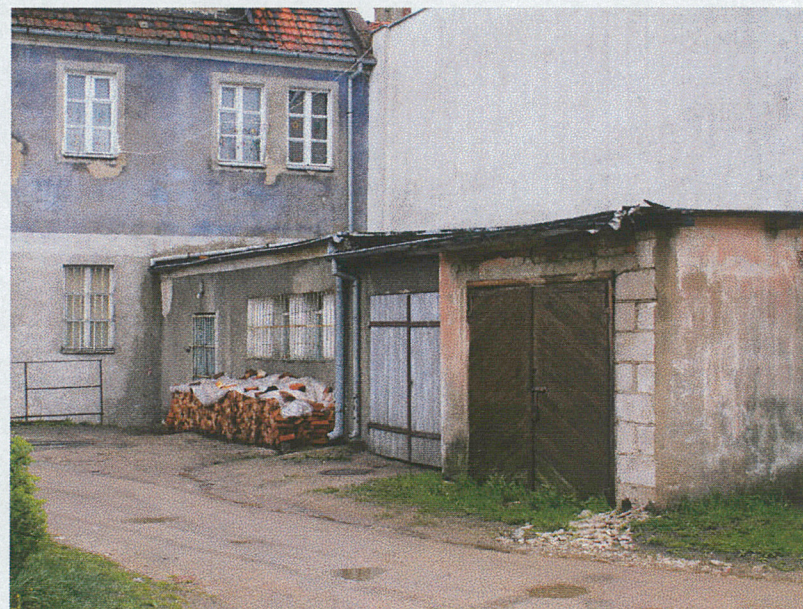
Dobudówki od strony wschodniej