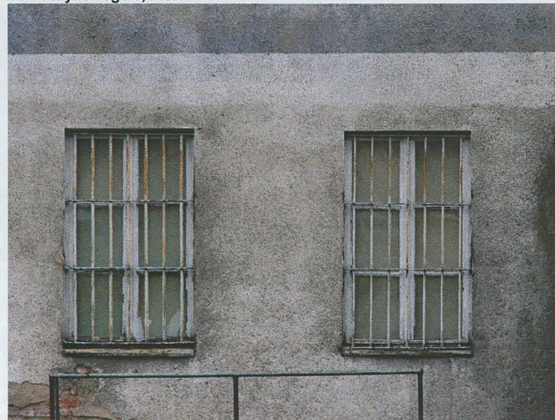
Otwór okienny na I kondygnacji – elewacja wschodnia