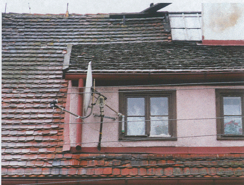
Okna w poddaszu użytkowym