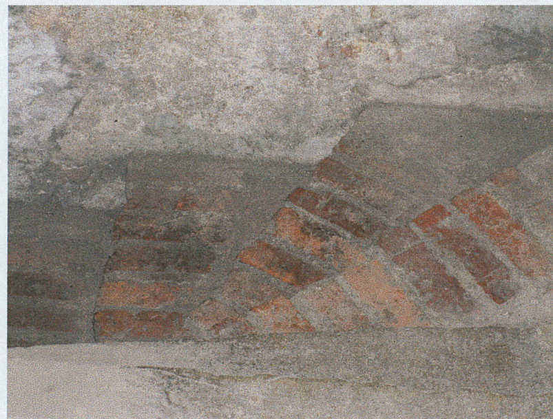
Schody do piwnicy