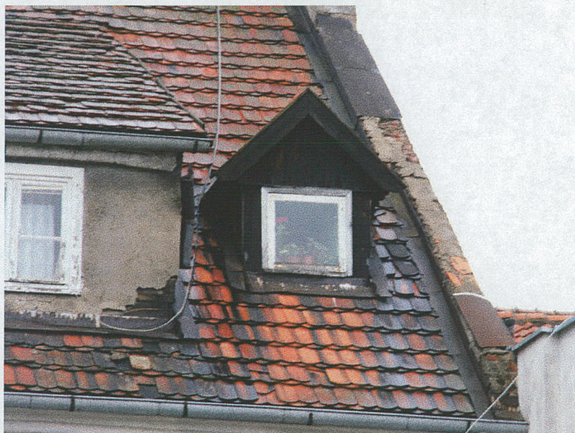
Lukarna – strona wschodnia