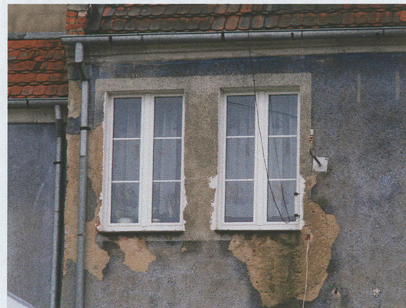
Otwór okienny na II kondygnacji – elewacja wschodnia (a)