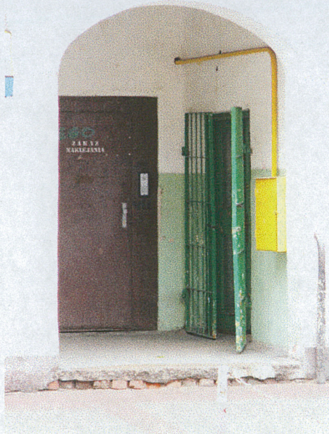
Wejście do budynku – strona zachodnia