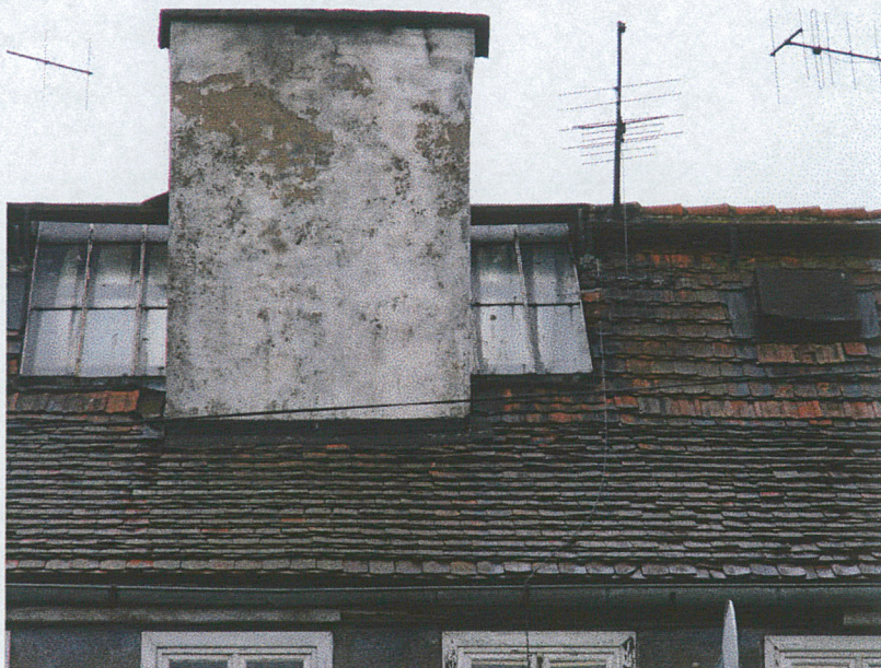
Przeszlony dach – strona wschodnia