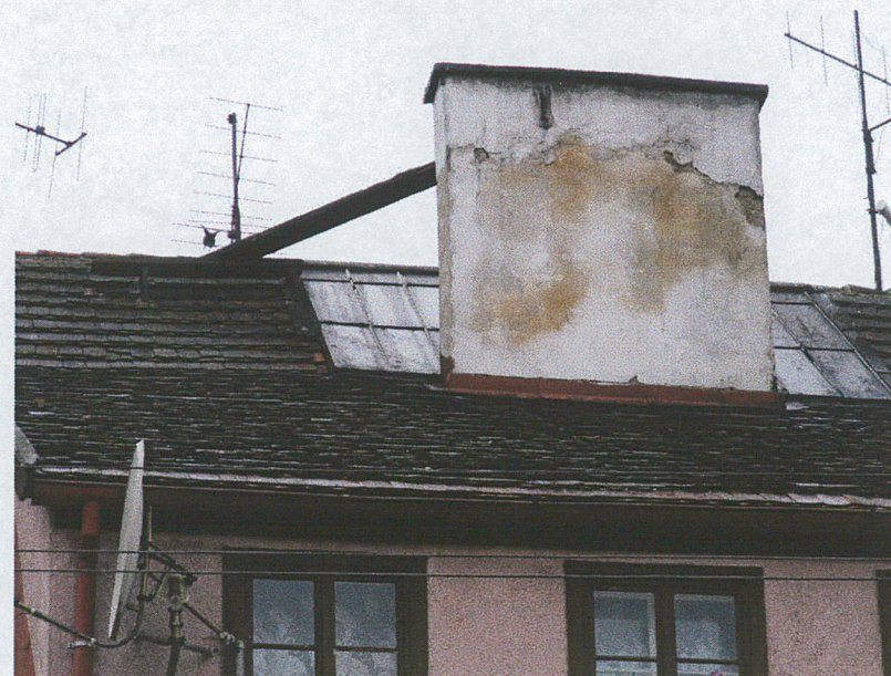
Przeszlony dach – strona zachodnia