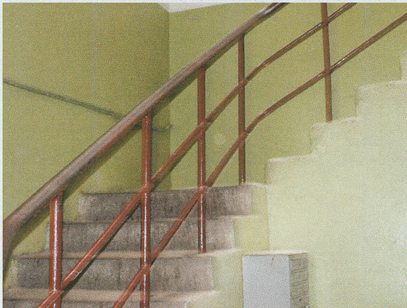
Klatka schodowa – poręcze i schody