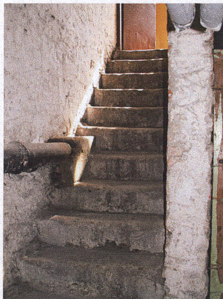
Zejsście do piwnicy b