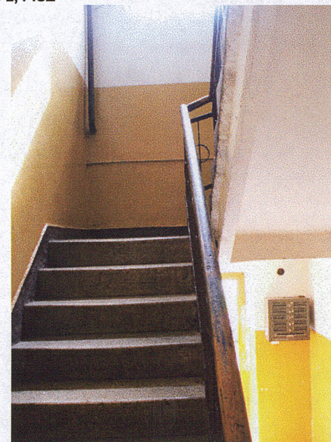
Klatka schodowa b