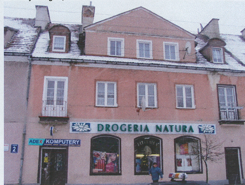
Elewacja zachodnia b