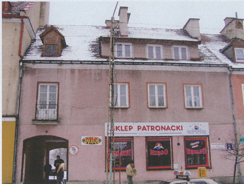
Elewacja zachodnia a