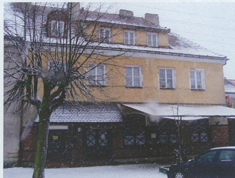
Elewacja zachodnia d