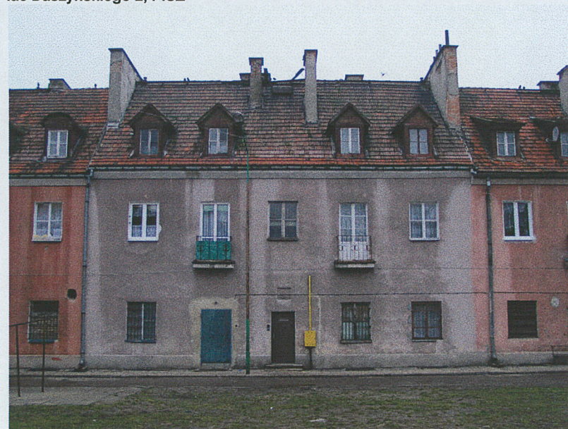
Elewacja wschodnia b