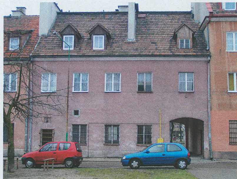
Elewacja wschodnia d