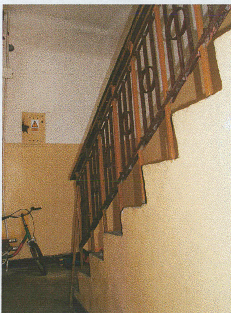
Klatka schodowa a