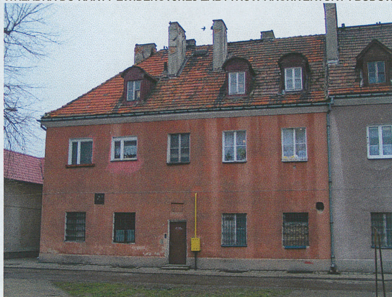
Elewacja wschodnia a