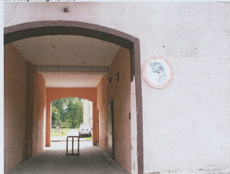
Jedno z wejść do budynku