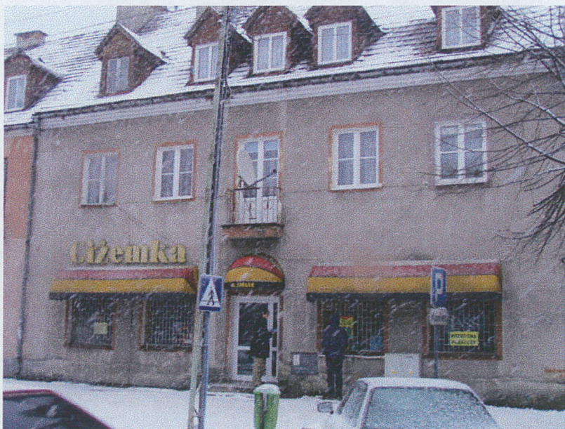
Elewacja zachodnia c