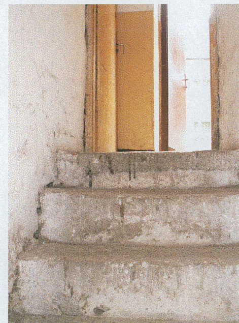
Zejsście do piwnicy a