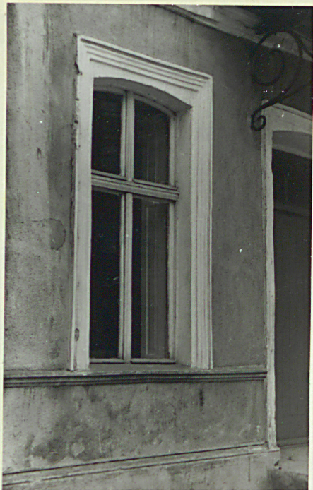
Fronton, okno parteru.