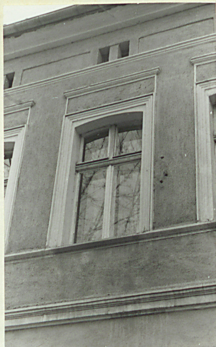
Fronton, okno piętra.