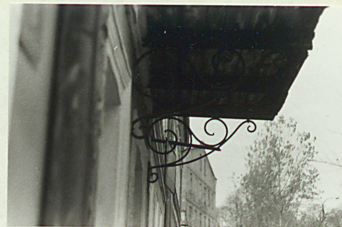
Detal podtrzymujący balkon.