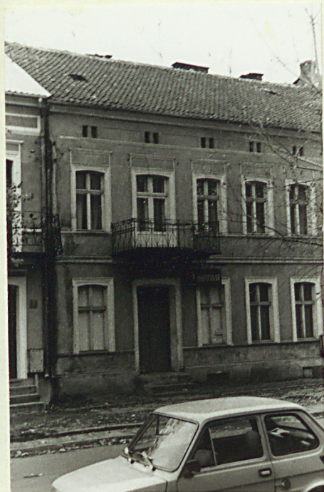
Fronton, część zach.