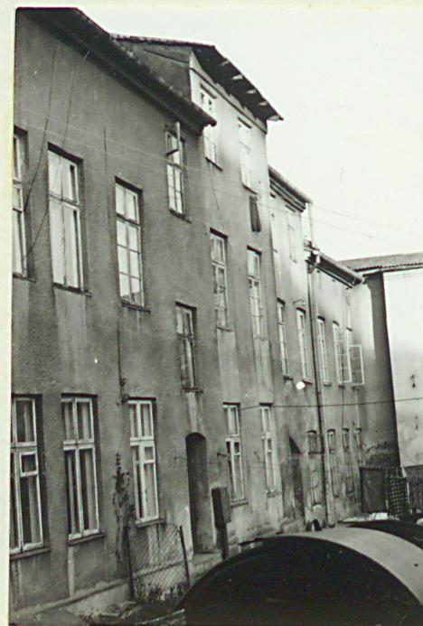
Elewacja tylna, zbliżenie z widokiem na bramę.