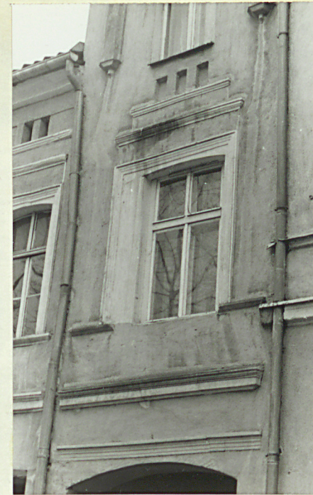
Okno nad wjazdem.