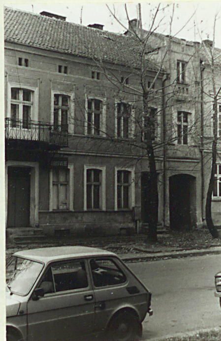
Fronton, część wsch.