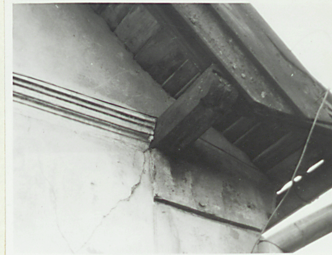
Fragm. okapu w ryzalicie