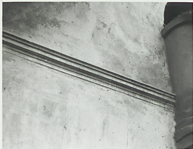
Fragm. gzymsu w elew. pód.