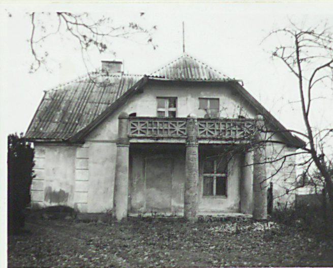
Elewacja płd. - szczytowa