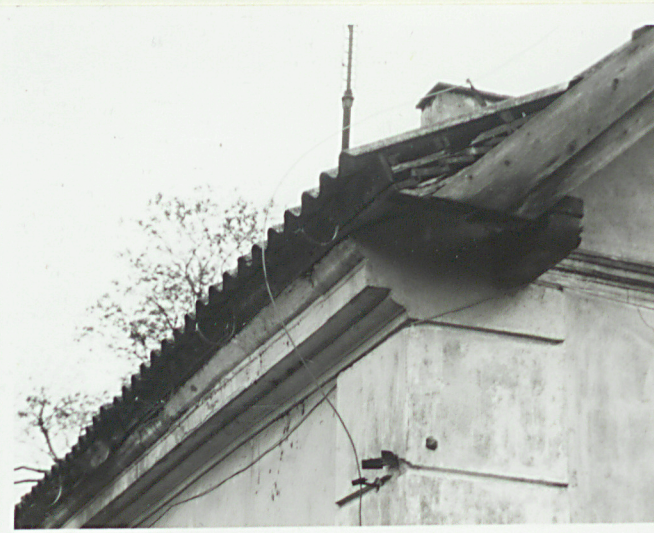
Gzyms w elewacji wsch.