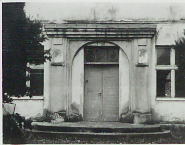
Ryzalit - wejście gł.