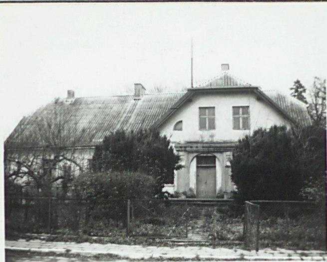
Elewacja zach. - frontowa