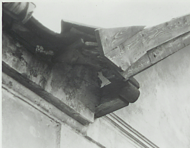
Elew. pód.- koniec murłatu