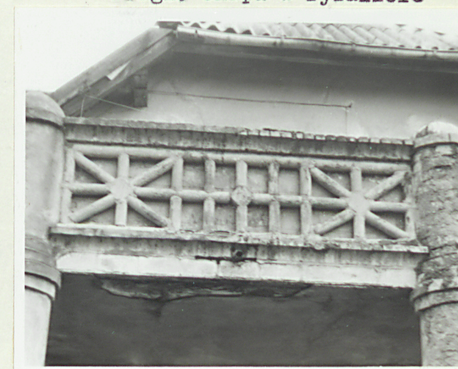
Fragm. balustrady balkonu