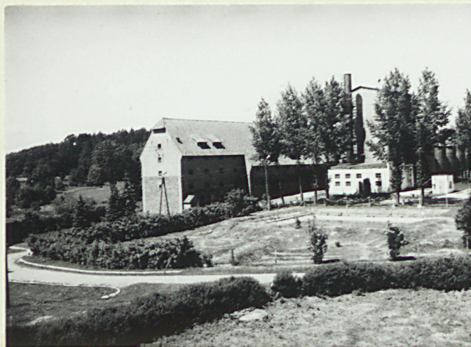
Spichlerz i gorzelnia