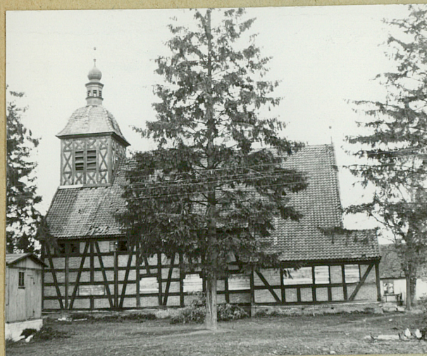
STAN Z 1964