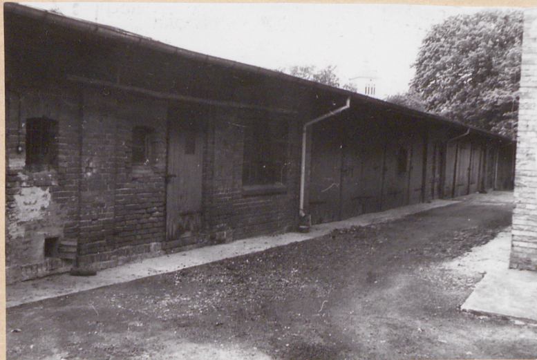
WIDOK NA ELEWACJE PD.-WSCH.