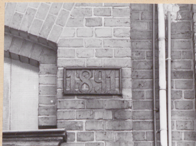
wywieszka z datą wzniesienia budynku