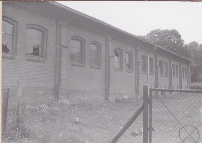
elevacja wsch. od pld.