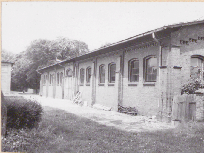
widok od strony pld.-zach.