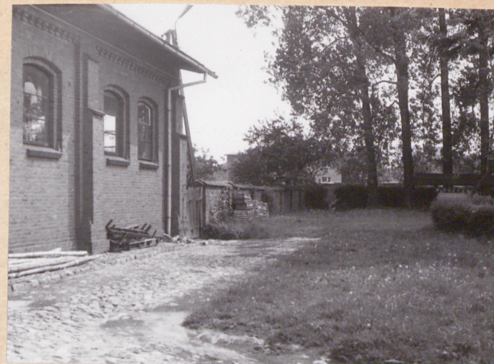
bruk, chodnik i murulek graniczny PSO