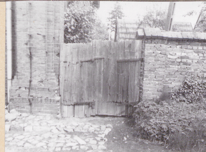
brama i murcek ogródka warzyw. PSO