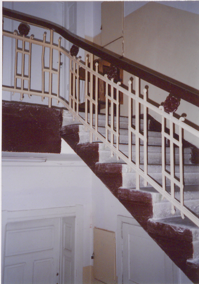
2. Bariierka, detal, neg. 1300/682/3