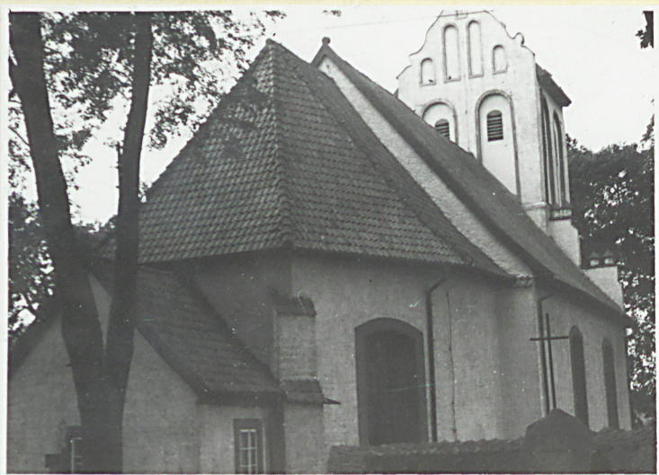
Widok kościoła od pn.-wsch.