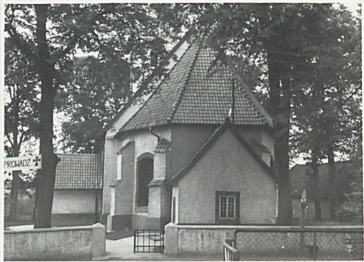
Widok kościoła od wsch.