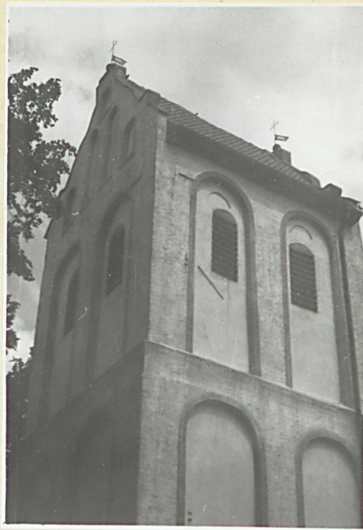
Górna część wieży