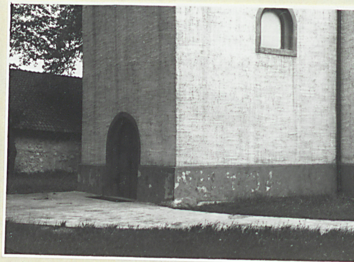
Dolna część wieży