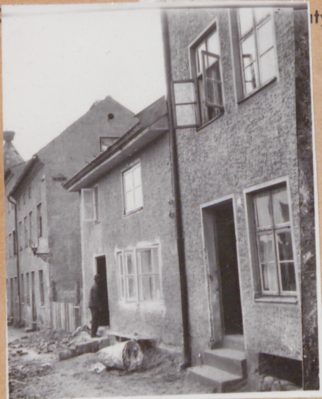
ityczny, uwagi opisowe, fotografia